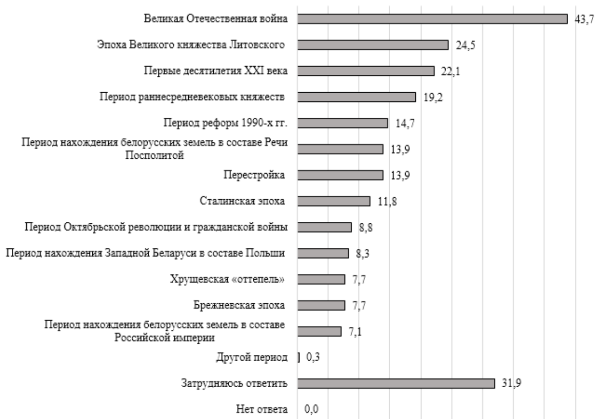
Рис. 1. Наиболее интересные исторические периоды для молодежи Беларуси, %