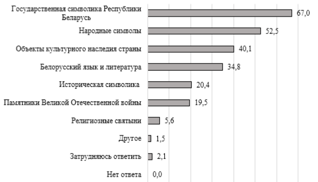
Рис. 3. Главные национально-исторические символы Беларуси по мнению молодежи страны, %

Формированию представления об особенностях воспроизводства исторической памяти в общественном сознании молодежи Беларуси помогает анализ основных источников информации для респондентов об исторических событиях, явлениях и процессах, происшедших в Беларуси. Проведенный социологический опрос показал, что в данном контексте молодежь Беларуси отдает предпочтение главным образом интернет-ресурсам, под которыми подразумеваются новостные порталы, сайты информационных агентств и т. д. (58,1 %). Также достаточно важными для молодых людей источниками являются телевидение (41,0 %) и книжные издания, а именно художественная, научная и справочная литература (37,2 %). Социальными сетями (Одноклассники, ВКонтакте и др.) для получения информации об исторических событиях в Беларуси пользуются 30,1 % опрошенной молодежи; в гораздо меньшей степени популярны мессенджеры Viber, Telegram, которые указали 11,5 % опрошенных. Прессу (газеты, журналы и др.) отметили 13,0 % молодых людей, радио – 5,0 %. Также информация об исторических событиях в Беларуси может поступать в процессе коммуникации молодых людей с родственниками, друзьями или знакомыми (17,7 %), с коллегами по работе или учебе (10,6 %). Затруднения с ответом на данный вопрос возникли у 3,2 % опрошенных (рисунок 4).