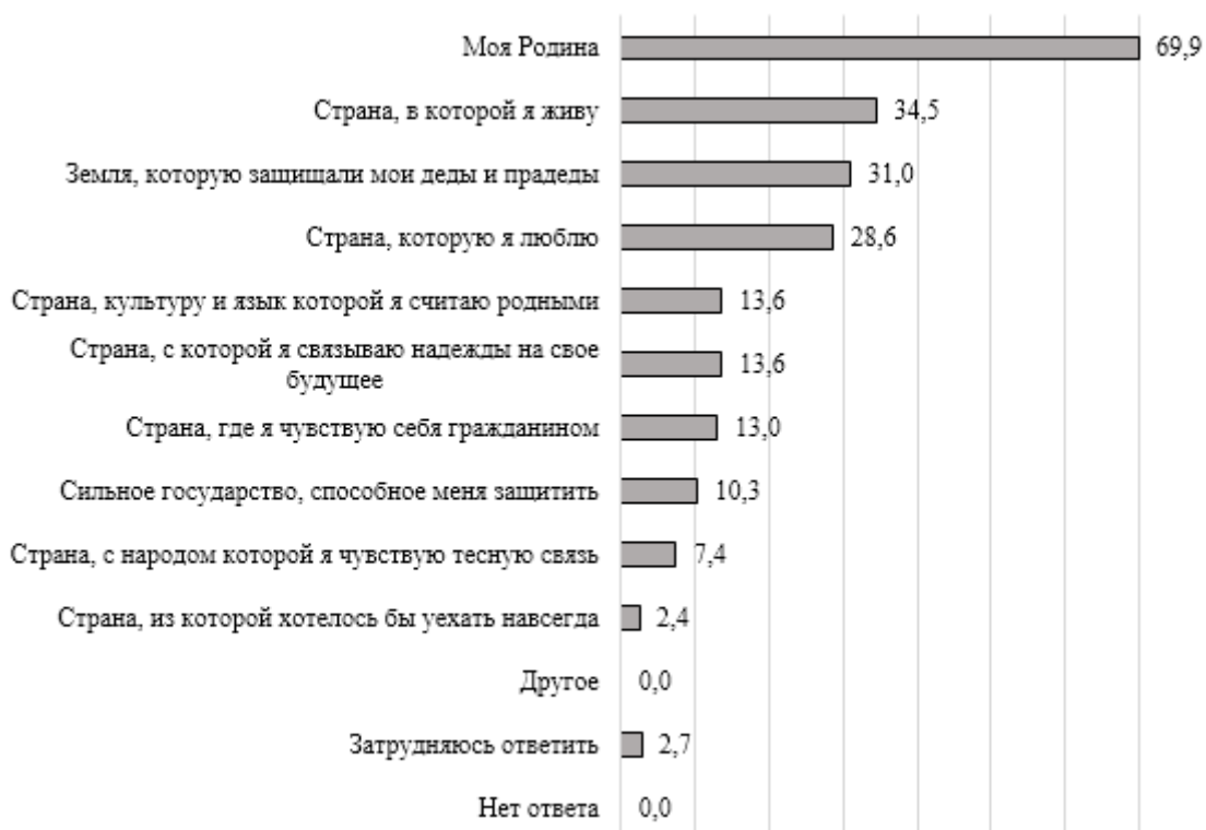
Рис. 2. Ассоциативные представления молодежи страны со словом «Беларусь», %

Еще одним важным аспектом проблематики исторической памяти является изучение национально-исторических и культурно-нравственных символов, в которых находят свое выражение многие материальные и духовные аспекты человеческого бытия, высокие идеи и смыслы, что позволяет рассматривать их в качестве индикаторов культурного развития социума.