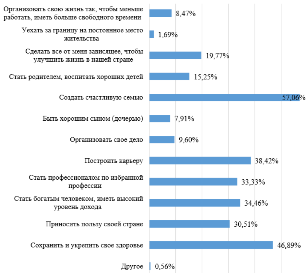
Рис. 2. Жизненные цели первокурсников

Исходя из представленных данных, для студентов Академии управления из числа первокурсников значимыми являются традиционные ценности, характерные для белорусского социума в целом и для белорусской молодежи в частности. Полученные данные подтверждаются результатами исследования белорусской молодежи, проведенного по заказу Белорусского института стратегических исследований (БИСИ) в мае 2024 года (объем выборки – 1500 респондентов), в которых отмечается, что семейные ценности остаются для молодежи ведущими, а важность и значимость семьи для себя отмечает подавляющее большинство молодых людей (70,2%) [5]. Также Белорусский комитет молодежных организаций (БКМО) совместно с Белорусским институтом стратегических исследований (БИСИ) в октябре 2024 г. провели онлайн-опрос по изучению тенденций в молодежной среде. В нем приняли участие 9000 белорусов в возрасте от 17 до 35 лет. Более половины респондентов заинтересованы в укреплении здоровья, работе и построении карьеры в своей стране, что также подтверждает устойчивость жизненных целей белорусской молодежи [7].