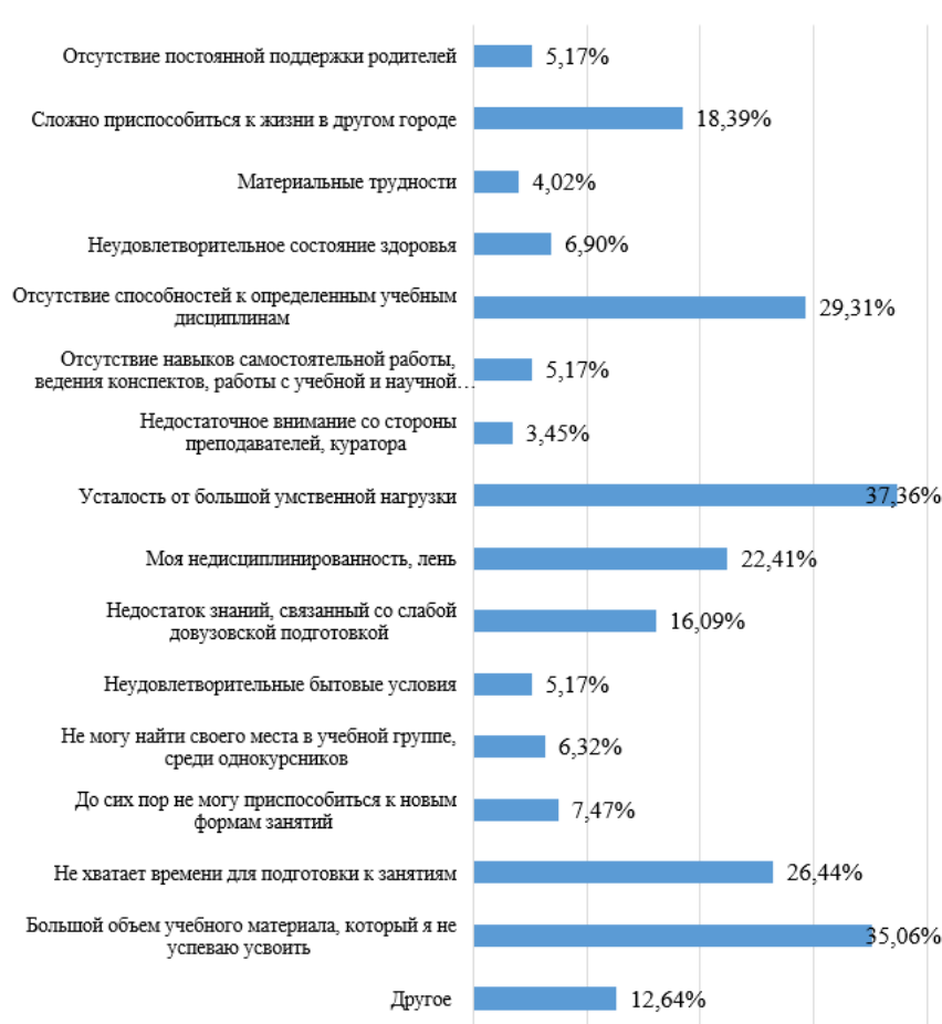
Рис. 4. Проблемы студенческой жизни

Перечисленные проблемы, с которыми столкнулись студенты, являются результатом нового для них студенческого опыта, формата учебы и работы с литературой и образовательными материалами, все они могут быть отрегулированы в ближайшем будущем при помощи самодисциплины и адаптации к образовательному процессу.