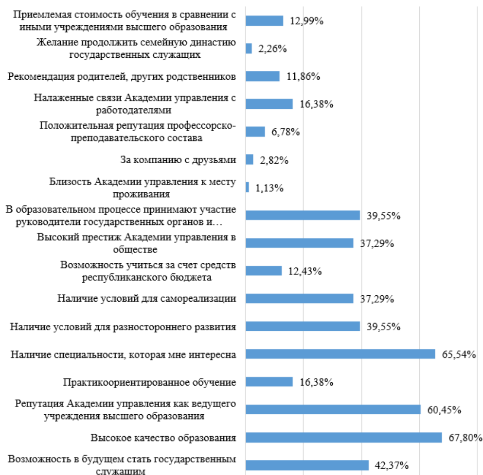
Рис. 1. Причины выбора Академии управления для получения высшего образования

На вопрос о престижности выбранного учреждения образования («На Ваш взгляд, быть студентом Академии управления престижно?») подавляющее большинство опрошенных (86,8%) выбрали вариант «Да, очень престижно», в то время как все остальные первокурсники отметили вариант ответа «Скорее престижно, чем нет».