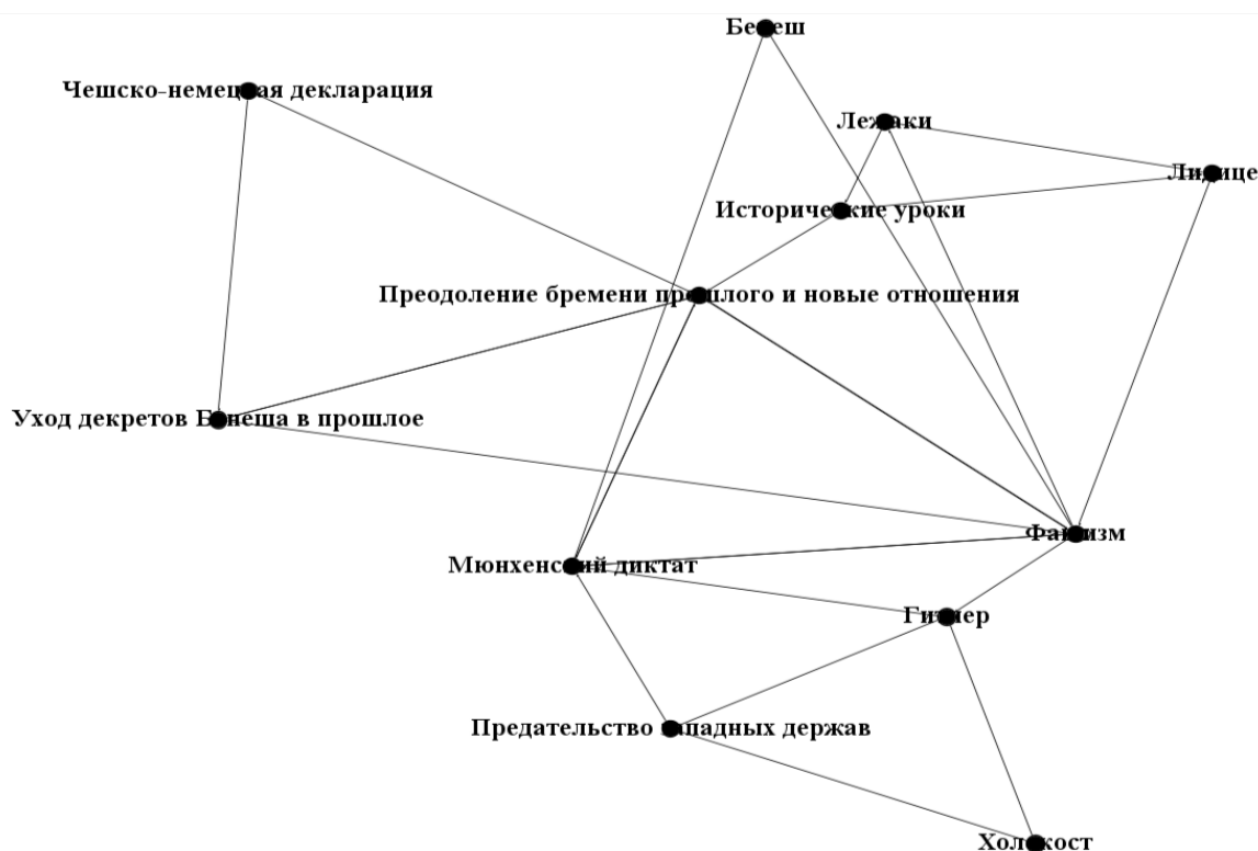
Рис. 3. Символическая система в 2004–2023 гг.

названы и закрыты декларацией в 1997 г.» 9 . Декларация сама становится одним из основных символом ухода разногласий по поводу судетских немцев и их имущества в прошлое (рис. 3).