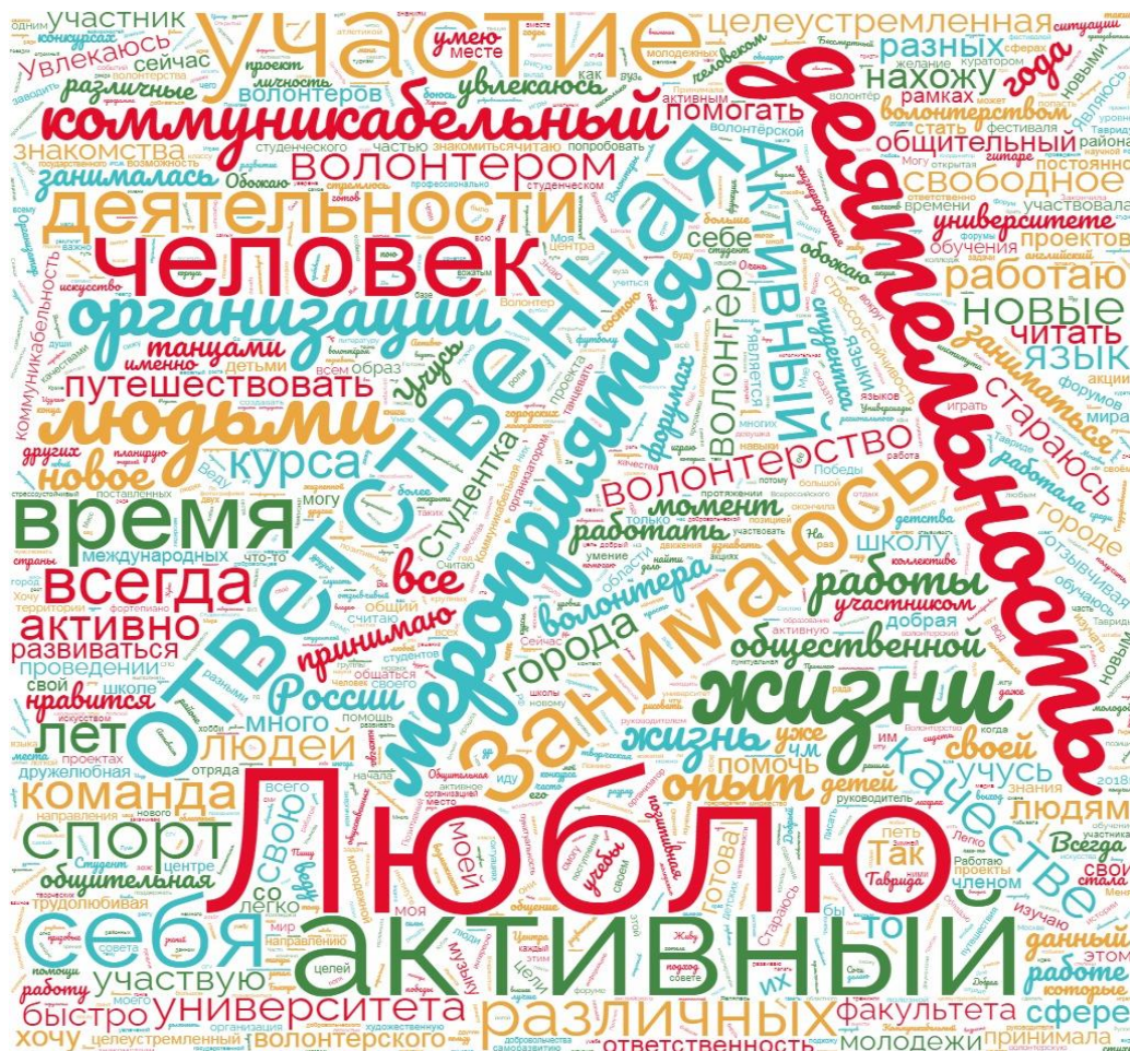
Рис. 2. Облако слов самоописания волонтерами своих качеств, целей и мотивов

При использовании уточняющих маркеров ответственности можно выделить следующие контексты: пунктуальность, дисциплинированность («ответственна – пунктуальна и дисциплинирована»), исполнительность («ответственно подхожу к выполнению поставленных задач»), результативность («довожу любое дело до конца»), инициативность («брать на себя ответственность и выполнять все поручения в заданный срок»), «возлагать ответственность на себя»), субъектность («я ответственный студент»), пунктуальность («никогда не опаздываю и ответственно отношусь к встречам»), серьезное отношение к жизни («веду здоровый образ жизни, серьезная и ответственная»), требовательность («ответственный и амбициозный человек, очень требователен в работе как к себе, так и к подчиненным»), старательность («стараюсь все делать идеально»). В ряде случаев используются слова-усилители: «очень ответственный», «чересчур», «до тошноты», «с высоким уровнем ответственности». В крайне редких случаях используются словосочетания по типу «ответственный подход», «ответственно отношусь». Ценностное значение придается через использование прилагательного «добросовестный» (11 упоминаний) – авторы стараются подчеркнуть внутреннюю значимость для себя ответственности, упоминая эти качества одновременно: «ответственная и добросовестно отношусь к работе».