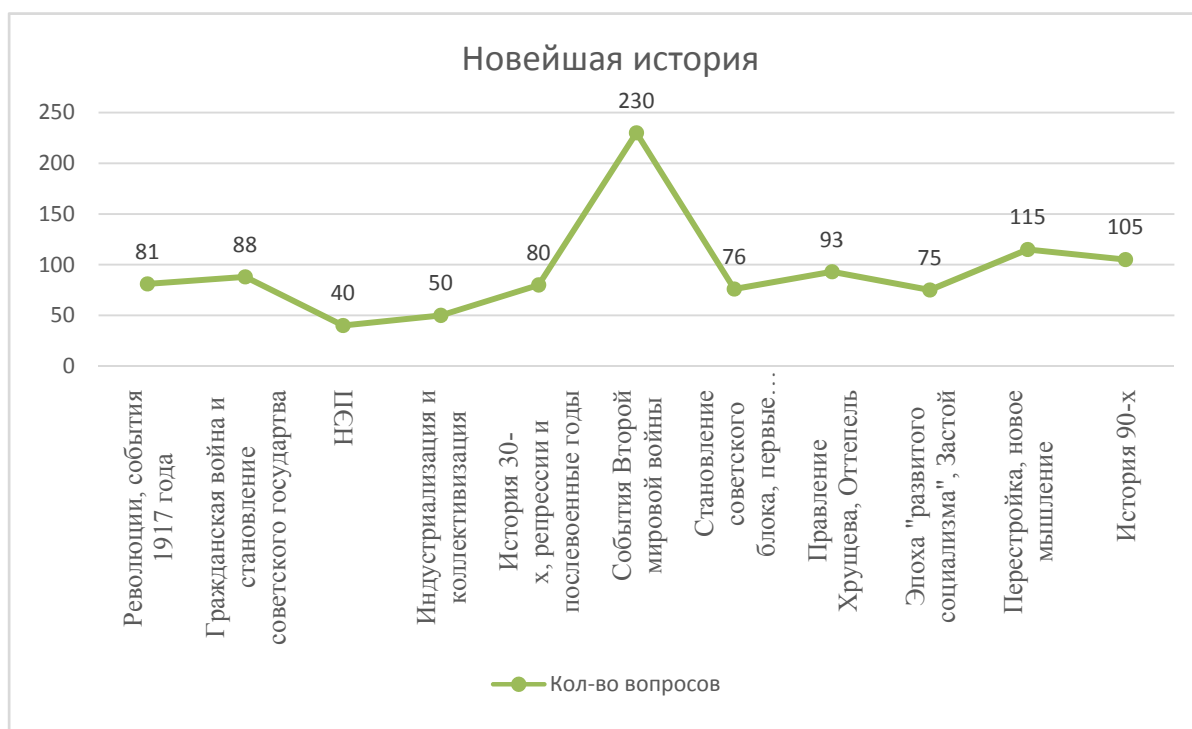
Рис. 3. Представленность вопросов по Новейшей истории

С другой стороны, вопросы о трагических страницах российской истории, таких как Первая мировая и Русско-японская войны, встречаются достаточно редко: 30 и 35 вопросов соответственно. Эти две проигранные войны воспринимаются как ошибки, воспоминание о которых не вписывается в логику «славного прошлого».