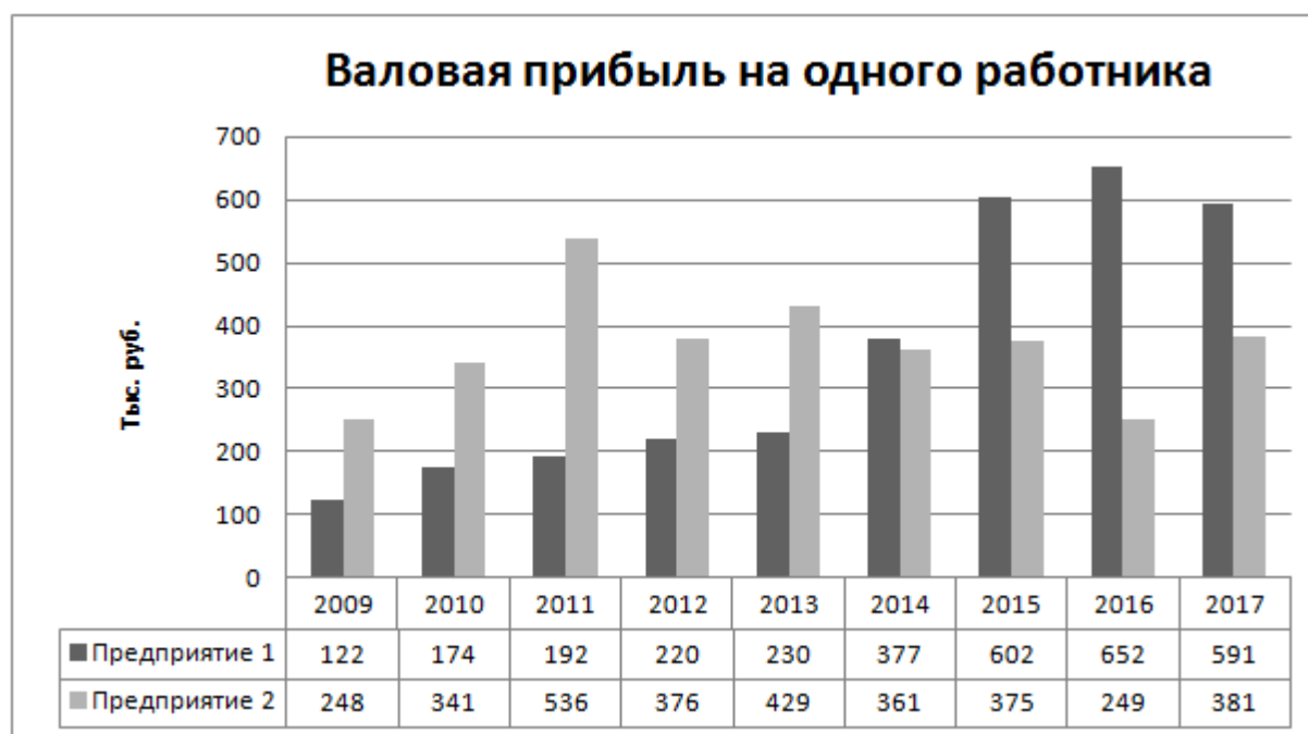
Рис. 1. Динамика показателя валовой прибыли на одного работника на предприятиях 1 и 2 в 2009–2017 гг. (тыс. руб.)

На наш взгляд, этот факт сам по себе интересен. Он демонстрирует существенно более высокий уровень исполнительской дисциплины на Предприятии 1. Подчеркнем, что неукоснительное подчинение каждого работника своему непосредственному руководителю, строгая дисциплина и порядок — это необходимые условия успешной реализации РМТО.