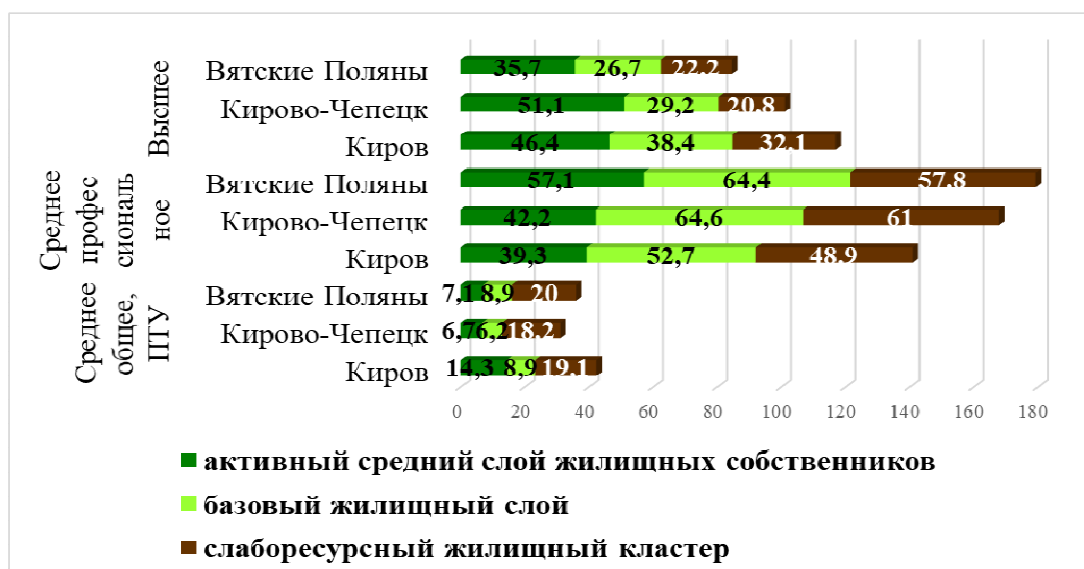
Рис. 4. Уровень образования представителей кластеров (% от представителей кластера)