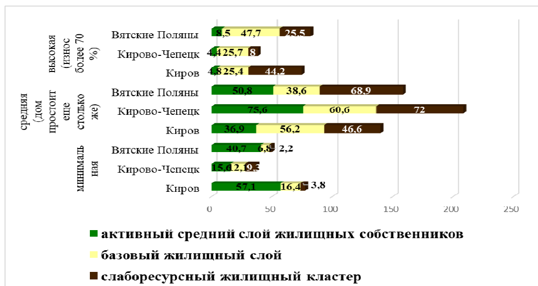
Рис. 3. Оценки представителями кластеров степени износа дома, в котором они проживают (% от представителей кластера)