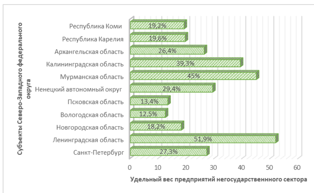
Рис. 2. Удельный вес негосударственных организаций социального обслуживания в общем количестве организаций социального обслуживания всех форм собственности, включенных в реестр поставщиков социальных услуг субъектов Северо-Западного федерального округа (%) [сост. по: сост. по: Распоряжение Правительства Российской Федерации № 1284-р от 19.07.2017]

Fig. 2. Density of non-state social service organizations in total number of social service organizations of all forms of incorporation included in register of Northwestern Federal District social service providers (%) [based on Ranking of the Russian Federation Regions after Implementation of Socially Oriented Nonprofit Organizations and Social Entrepreneurship Support..., 2018]