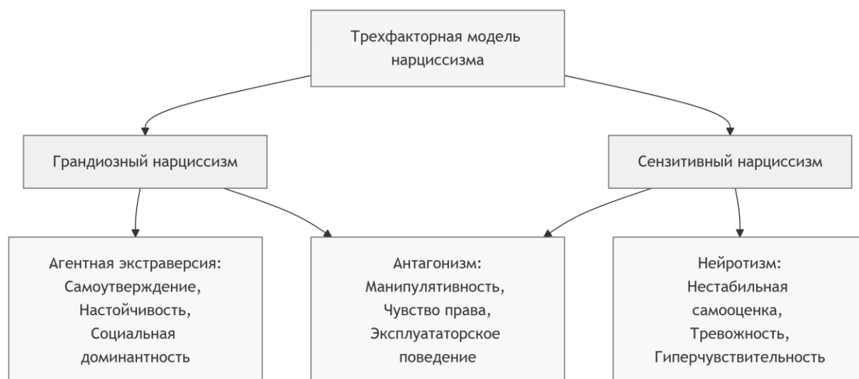
Рис. 1. Трехфакторная модель нарциссизма Дж.Д. Миллера [Miller J.D. et al., 2021]

представлен как широкий феномен, опирающийся на другие личностные черты, и рассматривается в виде грандиозного и сензитивного нарциссизма.