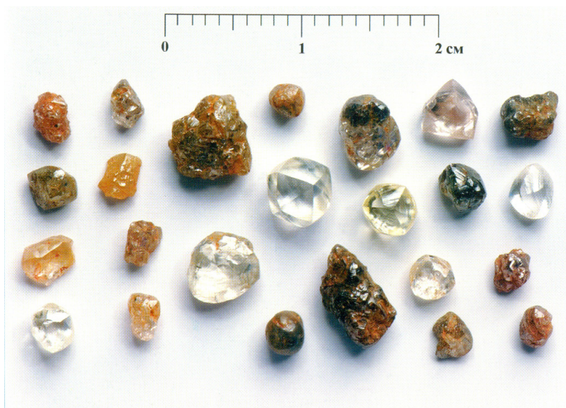
Рис. 1. Алмазы из неоген-современной россыпи Верхний Биллях (Эбеляхское поле).

или уральского типа). Эти обстоятельства, а также необычность некоторых их особенностей (изотопически легкий состав углерода алмазов V и VII разновидностей, преобладание алмазов эклогитовых парагенезисов, высокая степень механического износа, недостижимая в фанерозойских условиях россыпеобразования и ряд других) позволили предполагать [3-5, 8] происхождение алмазов из докембрийских источников двух типов: а) тип кимберлитов или лампроитов, из которых могут происходить округлые ромбододекаэдровиды; б) неизвестные типы источников, из которых происходят алмазы V, VII и II разновидностей [9-14]. Алмазы V и VII разновидностей распространены только в россыпях северо-востока СП, что дает основание предполагать эндемичность их источников. Все потенциально докембрийские алмазы могли пройти через протерозойские прибрежно-морские россыпи. Это обстоятельство, а также более поздние физико-химические изменения, обусловили полное уничтожение индикаторных минералов-индикаторов (ИМК) коренных источников алмазов. Достоверно не выделены минералы – парагенетические или парастерические спутники этих алмазов, а кимберлитовые минералы (гранаты, пикроильмениты и хромшпинелиды) происходят из молодых кимберлитов и являются лишь гидравлическими попутчиками потенциально докембрийских алмазов [3, 20].