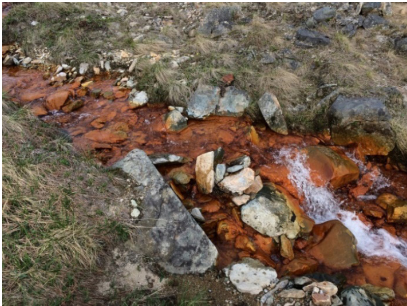
Рис. 2. Бурожелезняковые образования на дне ручья (Зона Донная)

По нашему мнению, гидроксиды железа являются продуктами разложения сульфидов. Ранее они были отмечены нами на многих объектах сульфидной минерализации. Наиболее сильно они проявлены на участках оттаивания в зоне многолетнемерзлых пород [13, 14]. Криогенные процессы способствуют разложению сульфидов, которые переходят в сульфатные фазы в виде кристаллогидратов металлов. Данный процесс подтвержден нами экспериментально [15]. Кристаллогидраты и другие продукты разложения сульфидов неустойчивы в экзогенных условиях. При попадании в воду они окрашивают ее в бурый цвет и окисляются до гидроксидов. Одной из устойчивых фаз разложения сульфидов железа являются именно гидроксиды железа в виде минералов гетита и гидрогетита и производные самородной серы.