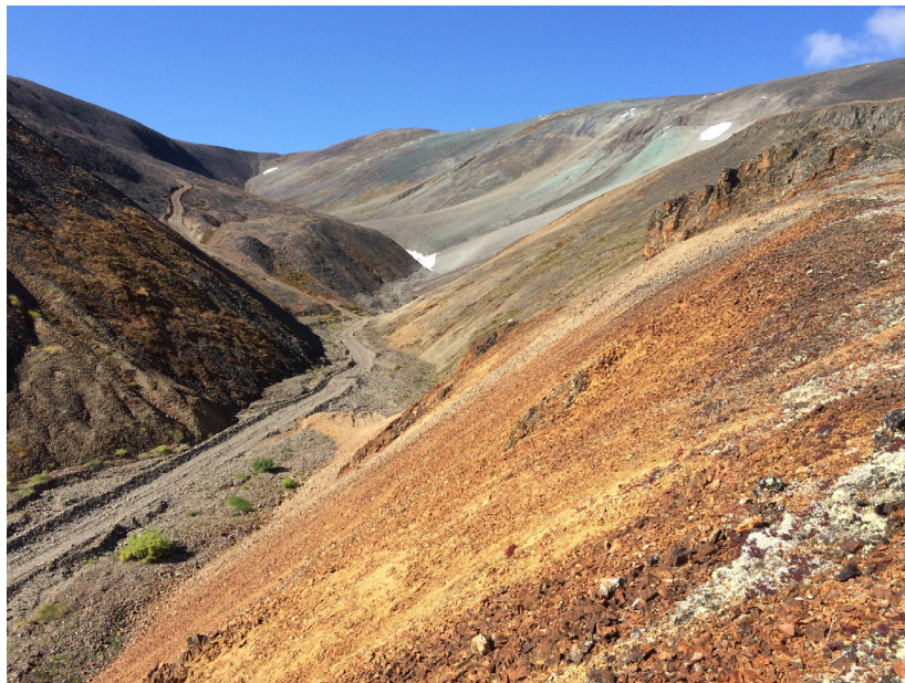
Рис. 3. Выходы сильно ожелезненных пород (Кремевая площадь)

На расположенной западнее, Канчалано-Амгуэмской лицензионной площади, Гуревич Д.В. [20] рассматривал аналогичные участки как один из