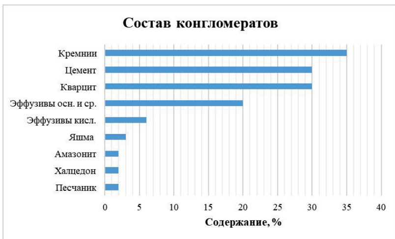
Рис. 1 Состав «металлоносных» конгломератов и кор выветривания по ним