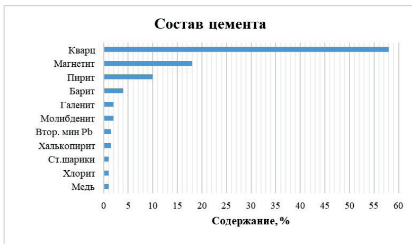
Рис. 2 Состав цемента «металлоносных» конгломератов и кор выветривания по ним

вторичные минералы Pb, самородная медь, хлорит и единичные знаки стеклянных сферул неясного происхождения. Содержание минералов проиллюстрированы на рисунке 2.