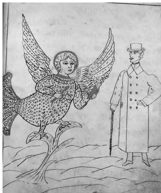
Рис. 6. Птица Сириин с книгой и человек. Миниатюра (Там же. Л. 42)

В стихе речь идет о молодом иноке, который столкнулся с бедой в своей жизни. С молитвой и слезами он обратился к Господу за помощью, рассказывая, что потерял «...церковный ключ... и золотую книгу» (Старообрядческий сборник эсхатологического содержания. Л. 41). Иносказательно читателю сообщается о потере духовного ориентира в жизни человека. Моло-