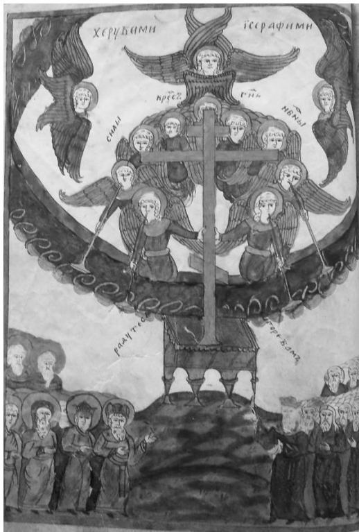
Рис. 9. Появление Креста Господня на небе. Миниатюра к «Слову Палладия мниха...» (Старообрядческий сборник эсхатологического содержания. Л. 50 об.)

По стилю исполнения эти миниатюры можно отнести к «северным письмам». Эта стилистика сложилась к XVIII в. в различных районах Русского Севера (Сев. Двина, Пинега, Вологда и др.) как общность оформительских традиций. Для нее характерны: условная лаконичная форма рисунка, яркие краски, преобладающими из которых являются красный и зеленый, широкие обрамляющие рамки, формат в четвертую долю листа. Стиль «северных писем» не был привязан исключительно к районам Русского Севера. Он широко применялся и в других регионах, и в центрах старообрядчества, прежде всего в беспоповских согласиях. В том числе имел хождение и на Урале, причем миниатюры здесь не копировались полностью, а «обрастали» собственными чертами и особенностями, в соответствии с образным восприятием и традициями региона.