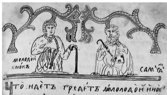
Рис. 5. Молодой инок и Господь. Заставка (Старообрядческий сборник эсхатологического содержания. Л. 41)

В помещенном далее духовном стихе о молодом иноке повествуется об этом, а составитель сборника попытался даже обозначить свою собственную роль в деле спасения людей (рис. 5). Текст стиха сопровождается неброскими, но тонко прописанными элементами оформления – заставкой в начале и миниатюрой в конце текста.