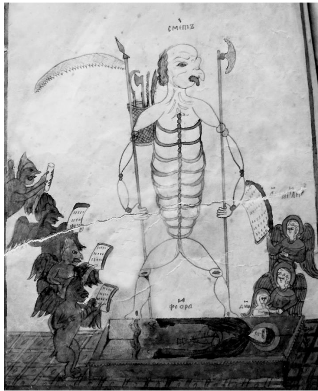
Рис. 10. Смерть, бесы и ангелы у гроба Феодоры. Миниатюра к «Житию Василия Нового...» (Там же. Л. 57 об.)

Так, на представленных миниатюрах сборника также преобладают традиционные яркие северные краски: красный, желтый – в элементах одежды ангелов, в обликах бесов, очертаниях земли и зеленый в одежде праведников, облике серафима и др. (рис. 9, 10). Яркий синий цвет тоже можно здесь встретить (одежда на грешниках, условная линия неба) (см. рис. 9). Однако