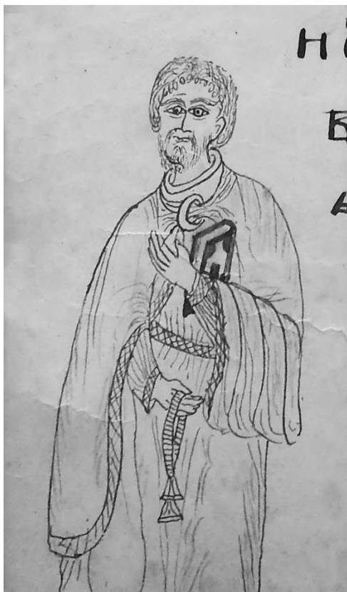
Рис. 3. Монах. Маргинальная миниатюра (Старообрядческий сборник эсхатологического содержания. Л. 16)