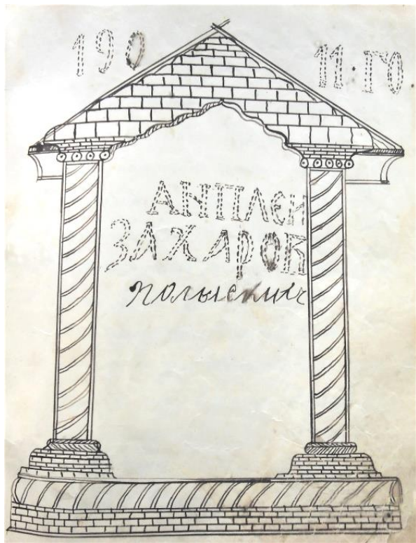
Рис. 1. Заставка-рамка с обозначением имени составителя и даты (Старообрядческий сборник эсхатологического содержания. Л. 44)

что составитель рукописи был не просто грамотным человеком, но, возможно, очень образованным, с широким кругозором и развитым интеллектом.