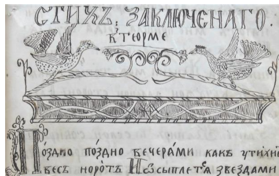
Рис. 2. Заставка (Там же. Л. 32)