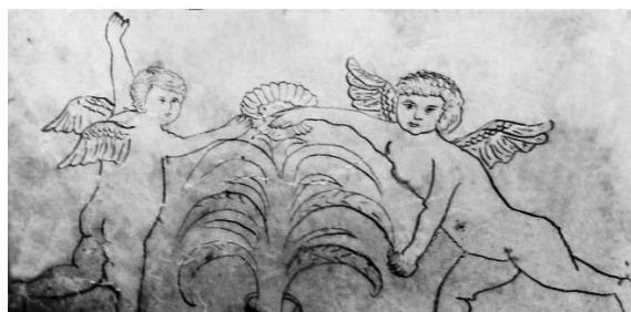
Рис. 8. Бесы и ангелы в концовках (Там же. Л. 6 об., 24 об.)

Между текстами духовных стихов составитель включает собственные мысли, пометы, выписки из сочинений. Так, на л. 12 он поместил «...Узаконения и завещания Стоглавого собора...». Это выписки из 31 главы Стоглава, со ссылкой на страницы (103 и 104), где обозначено правило о необходимости креститься двумя перстами.