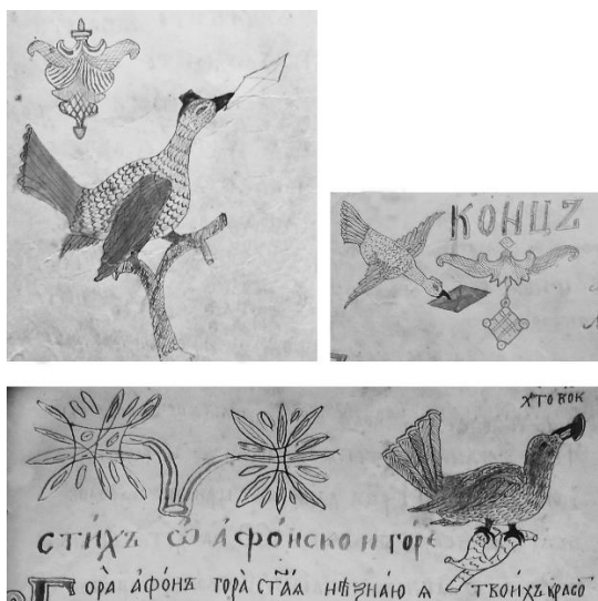
Рис. 7. Изображения птиц в заставках и концовке (Старообрядческий сборник эсхатологического содержания. Л. 3 об., 5 об., 13)

В тексте сборника можно увидеть много интересных живописных включений в виде заставок и концовок с птичками, несущими в клювах послания для людей (рис. 7). Выразительные концовки изображают либо ангелов, либо бесов – в зависимости от того, о чем говорится в стихе и что обещано верующему – рай или ад (рис. 8).