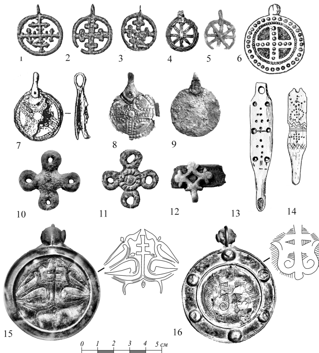
Рис. 2. Предметы с христианской символикой: 1–11 – подвески; 12 – накладки; 13, 14 – копоушки; 15, 16 – медальоны. 1, 3, 4, 10, 13, 14 – Пожегское городище; 9 – Карыбийвское городище. Могильники: 2 – Часадорский; 5, 6 – Кокпомъягский; 7 – Шойнаты III; 8 – Жигановский; 11, 12 – Ыджыдьбельский; 15, 16 – Лоемский

Сохранность подвески с Пожегского городища хорошая. Подвеска, найденная на Кокпомъягском могильнике, деформирована: кольцо и нижняя перекладина креста сломаны. Качество отливки небрежное.