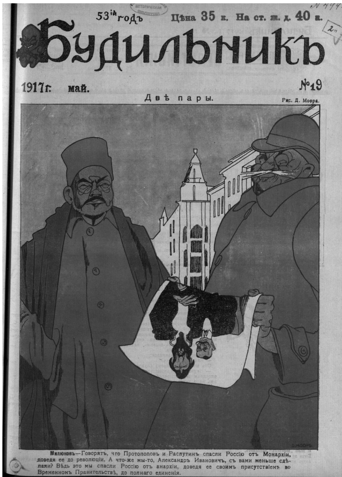
Рис. 1. Д. Моор «Две пары»

Насмеялся «Будильникъ» и над недавними призывами Александра Ивановича: