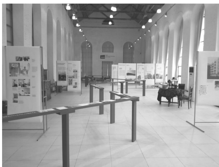
Рис. 2. Выставка «Городки Свердловска»: от архитектурного проекта к социальному опыту». Музей архитектуры и дизайна г. Екатеринбург.