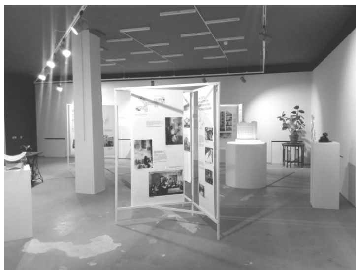
Рис. 3. Выставка «Городки Свердловска: от архитектурного проекта к социальному опыту». Центр авангарда, г. Москва