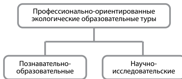
Рис. 1. Направления профессионально-ориентированных экологических образовательных туров [2]

Познавательно-образовательное направление профессионально-ориентированных экологических образовательных туров предполагает ознакомление туристов с наиболее интересными участками природных территорий, различными ландшафтами, флорой или фауной той или иной местности, а также способами их сохранения. В рамках данного направления используются различные формы организации эколого-образовательного процесса: учебные экологические тропы, образовательные экологические экскурсии, природоохранные образовательные походы, экологические лагеря [2].