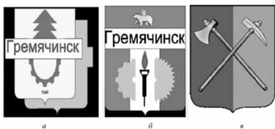
Рис. 2. Гербы г. Гремячинск, утвержденные в разные годы а) 1949 б) 1995 в) 2007

краткое название города Гремячинска — ГРЕМ, которое популярно у местных жителей. Аббревиатуры жители используют в каждом городе, но о них мало кто знает, если это не крупный город-миллионник или туристский город, поэтому мы решили отметить это на логотипе. Черный контур данных букв символизирует заповедник Басеги и его три вершины: Северный, Средний и Южный Басеги. Логотип можно использовать для печати на туристском снаряжении, одежде и обуви, а также стандартной сувенирной продукции: кружки, магниты, зонты, ручки, блокноты, календари и другие.