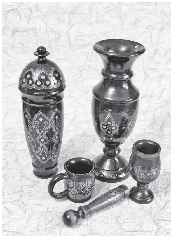
Рис. 2. Современные изделия унцукульских мастеров

Ремесло развивалось довольно быстро и уже во второй половине 19 века насчитывалось 500 мастеров. Юсуп Магомедов, адъютанта князя А. Чавчавадзе, занимался реализацией трубок и тростей в Темирхан-Шуре, благодаря чему унцукульские изделия получили промысловое развитие. Помимо мелких изделий (табакерки, трубки) изготавливались и крупные для музеев и городского населения. Например, на Кавказской сельскохозяйственной выставке в 1889 году выставались этажерки, изготовленные унцукульским мастером Шахбазом Ханбутаевым. Изделия унцукульских мастеров реализовывались по России и Кавказу, а также с большим успехом покупались они в Ростове-на-Дону,