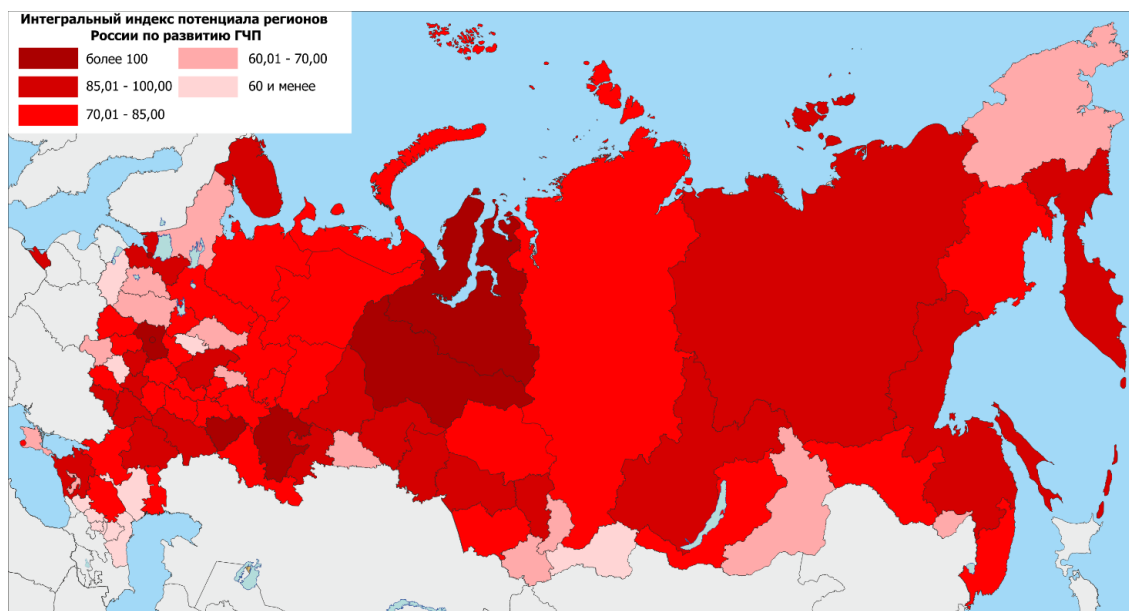
Рис. 3. Результаты расчета интегрального индекса потенциала регионов России по развитию ГЧП за 2019 г. [составлено автором на базе 1, 10, 13, 14]

Таким образом, лидерами интегрального индекса потенциала по развитию ГЧП в транспортной инфраструктуре являются, в первую очередь, регионы, отличающиеся высоким уровнем социально-экономического развития (см. рис. 3). Наибольшее значение интегрального индекса – у Москвы – 139,3, более 100 баллов также набрали (в порядке убывания) Санкт-Петербург, Московская область, Самарская область, Республика Башкортостан, Ямало-Ненецкий и Ханты-Мансийский автономные округа.