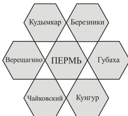
Рис. 1. Картоид пространственной структуры Пермского края

Проблемы функционирования организации краевого пространства. Социально-экономическое пространство Пермского края обладает свойством дискретности, проявляющимся по функциональным признакам. В процессе дискретизации происходят структурное разграничение и локация функционально ориентированных внутрикраевых пространств. В них ярко отражается специфика хозяйственной деятельности населения. В пределах социально-экономического пространства края явно выделяются индустриально развитый центр, горнохимический и лесопромышленный северо-восток, горнопромышленный восток, аграрный юго-восток, сельскохозяйственный в сочетании с промышленным производством юго-запад, агропромышленный запад и лесопромышленный с элементами сельского хозяйства северо-запад. Сочетание функционально разнородных пространств формирует пространственную структуру края, которую можно представить в формализованном виде (рис. 1). На картоиде раскрыты взаиморасположение и пространственные отношения между функционально разнородными территориями, принимающими шестиугольную форму. Пространственное строение Пермского края основано на единстве многообразия территориально локализованных социально-экономических систем, объединённых транспортными сетями и «коридорами» коммуникаций, а также тяготением к краевому центру.