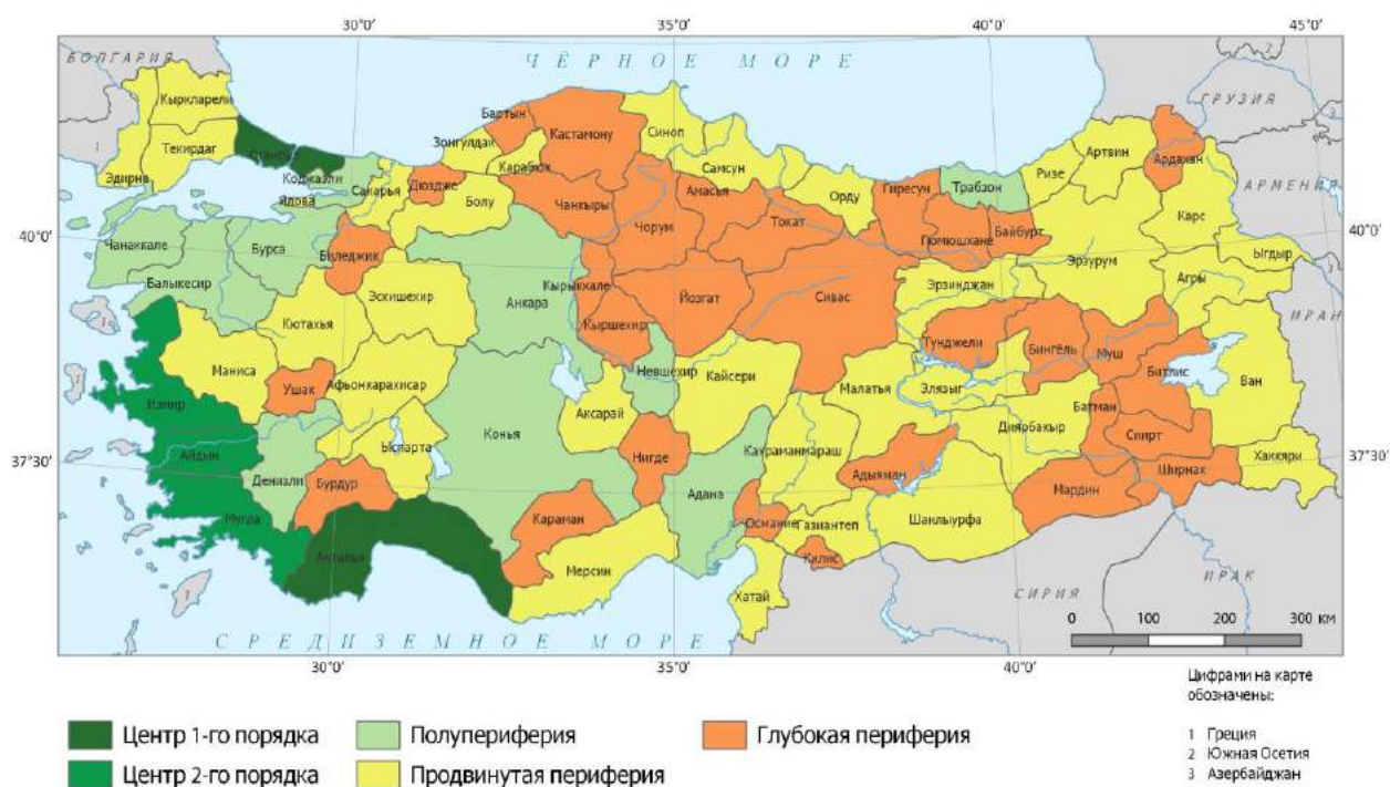
Рис. 3. Центрo-периферическая структура туризма в пределах Турции, 2015 г.

3. Современную территориальную структуру въездного и внутреннего туризма в Турции, представленную большей частью территории страны, отличает от предыдущих этапов ряд характеристик (рис. 3).