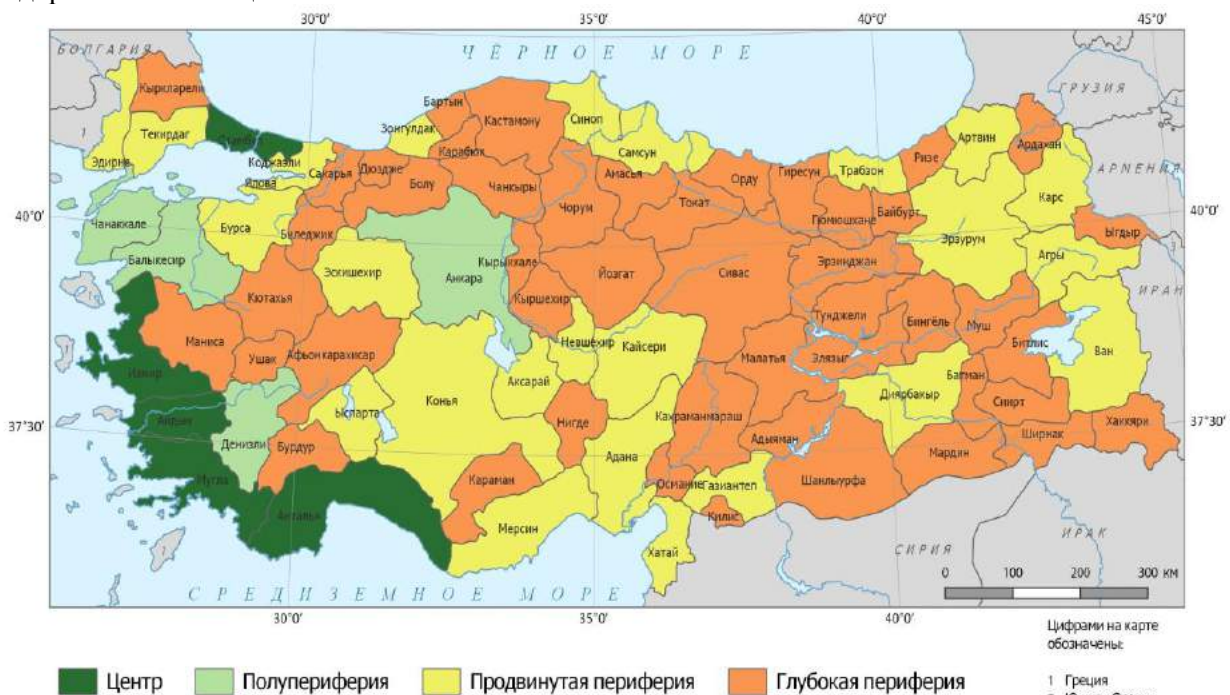
Рис. 2. Центрo-периферическая структура туризма в пределах Турции, 2005 г.

Трансформации в Ядре туристского пространства страны на данном этапе связаны с переходом ила Айдын из Полупериферии в Центр во многом благодаря развитию главной точки роста провинции – курорта Дидим, включенного Министерством культуры и туризма страны в перечень приоритетных регионов туристского развития [5]. Кроме того, увеличился разрыв между Центром и другими группами центрo-периферической структуры туризма в пределах страны по нескольким значимым признакам развития туристской системы: количество ночевков, проведенных иностранными туристами в коллективных средствах размещения, возросло до девяти, что превышает среднее значение данного показателя по стране в два раза, удельный вес Центра в общем объеме въездных туристских прибытий увеличился до 74%. Центр в рассматриваемый период отличился и функциональными изменениями, заключающимися в диверсификации региональных туристских предложений: началось продвижение морских круизов и туров с деловыми, лечебно-оздоровительными целями.