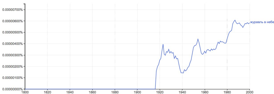
Схема 1. Частотность функционирования фразеологизма журавль в небе в русском языке по данным GBNV

И как раз на Никольской (в то время – улице 25 Октября) освободился целый этаж: выехала «Строительная газета». Конечно, хорошо бы особнячок отдельный, но это – журавль в небе. Отправил я туда чуть ли не всю редакцию: смотрите, решайте. Поехали, поохали: почти каждому выходит по комнате [Г. Я. Бакланов. Жизнь, подаренная дважды, 1999, НКРЯ].