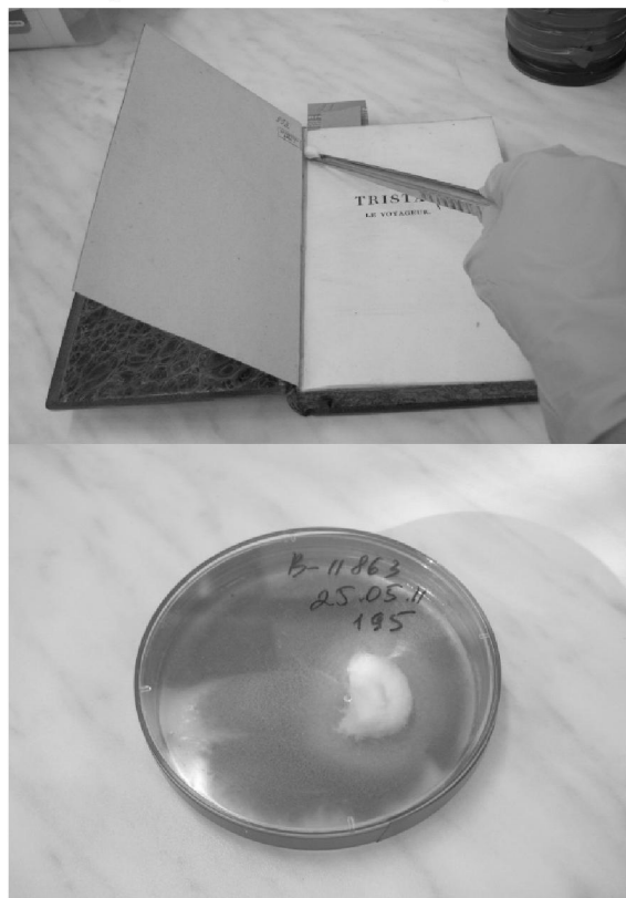
Рис. 2. Отбор проб стерильным тампоном с документов

чашках Петри на питательную среду Чапека-Докса. Для более точной и полной оценки количества жизнеспособных микроорганизмов на поверхности документа, налеты снимали сухим стерильным тампоном и помещали в стерильную воду. Полученную суспензию методом последовательных разведений высевали на питательную среду Чапека-Докса. Подсчитывали число колоний и определяли количество живых микроорганизмов на 1 \text{дм}^2 [Попихина, 2007, с. 65–75].