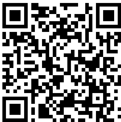
Рис. 2. Ссылка для скачивания специальной классификации информационных активов в сфере информационной безопасности

Полная специальная классификация ИА в сфере ИБ в исходном размере доступна к скачиванию по ссылке https://nextcloud.ussc.ru/index.php/s/YfS5tMiR6mTzfoX или QR-коду, представленному на рис. 2.