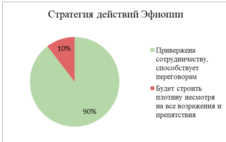
Рис. 3. Соотношение стратегий действий Эфиопии по строительству плотины. Источник: составлено автором.