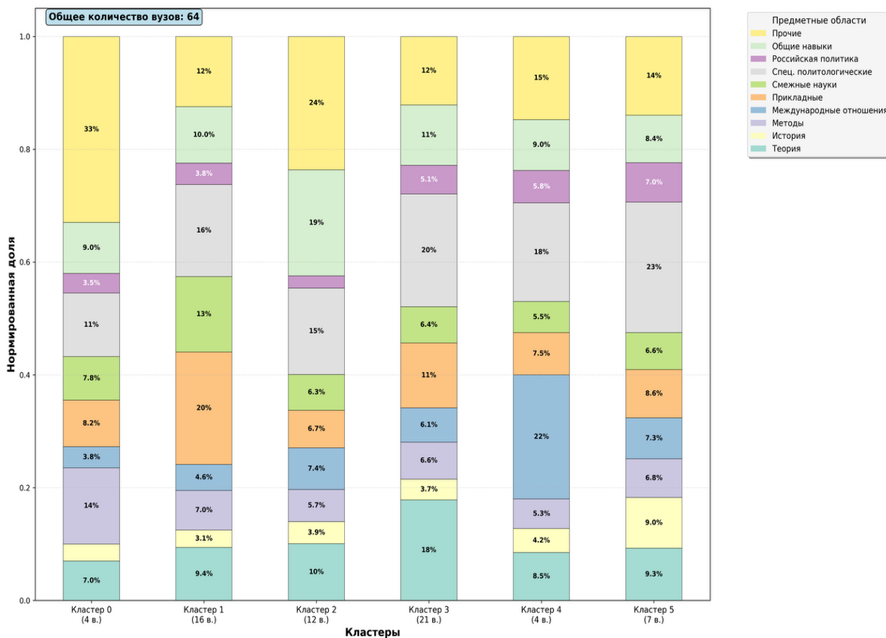
Рис. 2. Нормированное распределение долей по предметным областям по шести кластерам (выполнено авторами в Python)