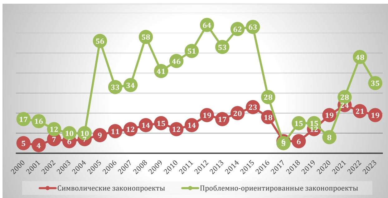
Рис. 1. Распределение проблемно-ориентированных и символических законопроектов

Публикационная активность определялась по количеству текстов, включающих релевантные ключевые слова, агрегированных из крупнейших отечественных поисковиков через системы «Медиа-логия», 3 «Интегрум» 4 . Корпус медийных публикаций формировался из общего массива новостей об экологии из российских федеральных и региональных СМИ, с опорой на единые поисковые запросы и формализованные критерии включения. Для подбора были заданы ключевые слова и словосочетания, отражающие экологическую проблематику (охрана окружающей среды, отходы и ТКО, мусорные полигоны, загрязнение, выбросы, климат, экологическая катастрофа и т.п.), после чего по этим запросам извлекались материалы из новостных лент. Использовались одновременно несколько источников, при этом в корпус включались только оригинальные тексты (без телепрограмм, дублей, автоматических перепечаток и кратких анонсов).