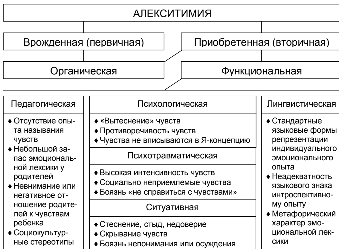
Рис. 1. Виды алекситимий

Чаще всего «жертвами» педагогической алекситимии становятся, конечно, мальчики (то есть будущие мужчины). В основном это связано с социокультурными факторами, в частности с гендерными педагогическими стереотипами, ограничивающими, во-первых, вербальную коммуникацию родителей с мальчиками в эмоционально значимых ситуациях, а во-вторых, окрашивающими эту коммуникацию в негативные тона. Другими словами, с мальчиками либо не говорят об их чувствах, либо воспринимают их переживания негативно. В результате мы имеем «настоящих мужчин», то есть мужчин, которые «не распускают нюни», «не жалуются», «не плачут» и т.д. Конечно, педагогически обусловленные социокультурные стереотипы «закрытого», «сдержанного», «невозмутимого» и т.д. человека присущи не только мужчинам, но и женщинам. Последние также ограничиваются в выражении