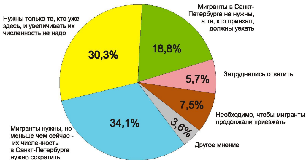
Рис. 3. Распределение ответов на вопрос «Нужны ли мигранты сегодня Санкт-Петербургу?» (% от числа ответивших, N = 1017)

На вопрос о том, нужны ли мигранты сегодня Санкт-Петербургу , дали ответ 1017 чел. Большинство респондентов ответили положительно (72 %), притом 34,1 % считает, что мигранты нужны, но в меньшем количестве, чем сейчас — их численность в Санкт-Петербурге надо сократить; 30,3 % считают, что нужны только те, кто уже здесь, а увеличивать их численность не следует; 7,5 % полагает, что необходимо, чтобы мигранты продолжали приезжать. 18,8 % респондентов считают, что мигранты в Санкт-Петербурге не нужны, а те, кто приехал, должны уехать. 5,7 % не смогли дать четкий ответ на этот вопрос, а 3,6 % (37 чел.) имели альтернативное (другое относительно предложенных вариантов ответов) мнение (см. рис. 3).