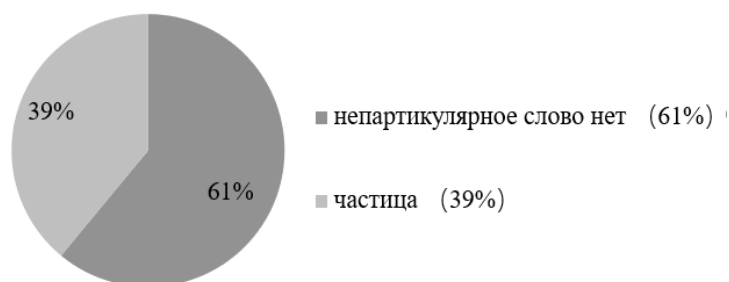
Рис. 1. Количественное соотношение употреблений партикулярного и непартикулярного НЕТ в материале исследования Fig. 1. The quantitative ratio between the use of the particular and non-particular NET in the material under study

24) а у Брэдбери$ в Марсианских_хрониках$ // да-да-да там () / одна семья по-моему только осталась и всё / а все остальные исчезли // *П нет / остался один (э-э) мужчина и одна (: ) женщина // да // @ да? *П а! (M1 # И1).