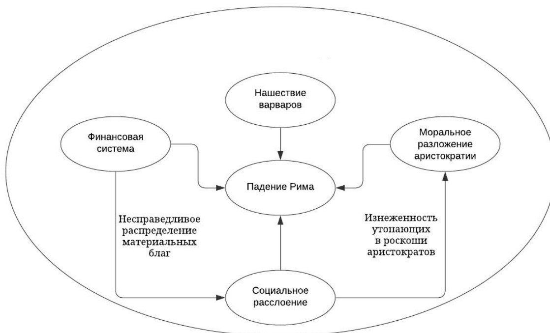
Рис. 1. Сложный мемплекс падения Рима

Дуглас Хофштаттер, описывая мемплексы, выделял «крючок» (hook) – положение, заставляющее людей распространять информацию дальше, и «наживку» (bait), которая должна привлекать внимание к комплексу и маскировать «крючок» [ Hofstadter , 1985, p. 54–55]. При этом нельзя сказать, что «наживка» – это простой придаток к «крючку», существование в одном мемплексе «выгодно» обоим его элементам. В рассматриваемом нами случае «крючком» были политические предложения, а античность исполняла роль «наживки». Ричард Докинз, желая показать, что популярность христианского учения во многом основывается на угрозе адского пламени, отмечал, что успех этой стратегии заключается вовсе не в изобретательности священнослужителей, а во взаимовыгодном существовании идей пламени и Бога, которое позволяет им выживать [ Dawkins , 1989, p. 192–193]. Так же и в нашем случае: политическим вопросам настоящего требуются ссылки на опыт прошлого, а исторические события становятся известными в широких кругах благодаря аналогиям с современностью.