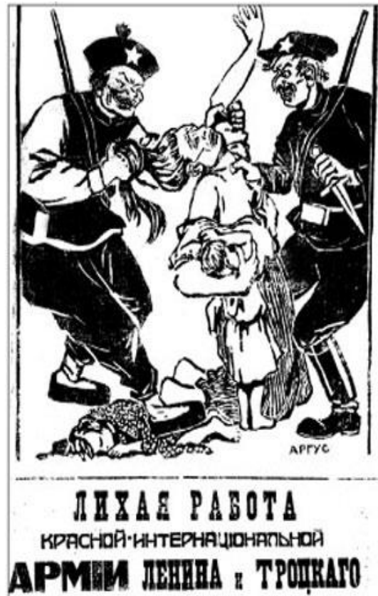
Рис. 3. «Лихая работа Красной интернациональной армии Ленина и Троцкого»