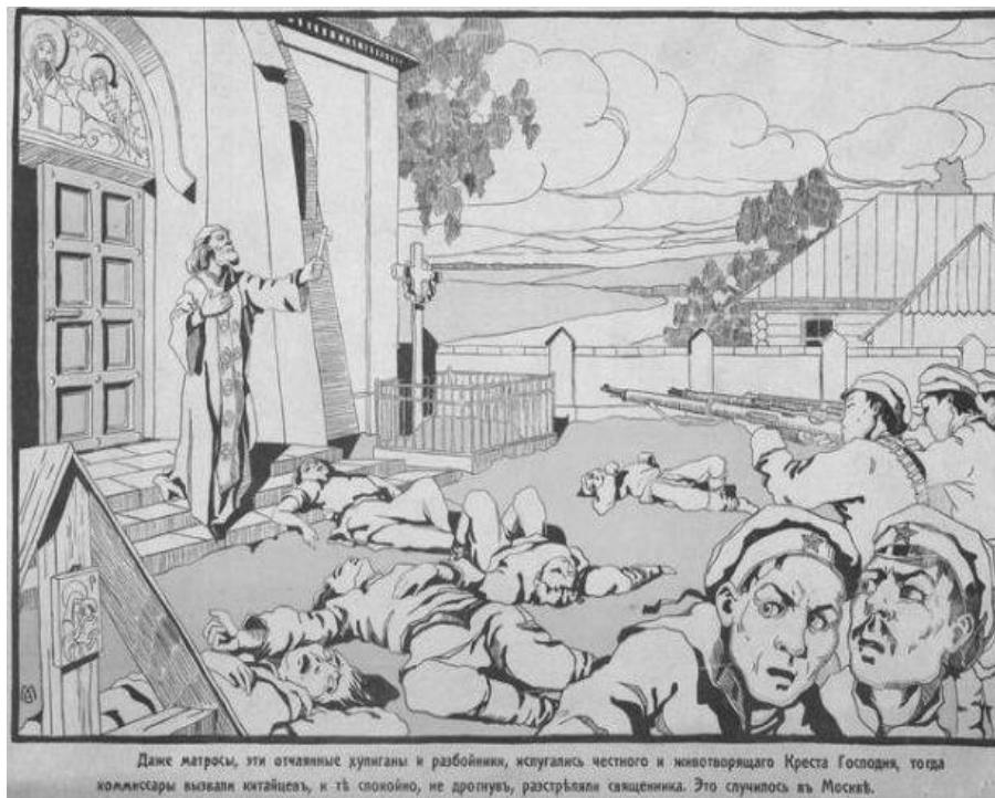
Рис. 4. «Даже матросы, эти отчаянные хулиганы и разбойники, испугались честного и животворящего Креста Господня, тогда комиссары вызвали китайцев, и те спокойно, не дрогнув, расстреляли священника. Это случилось в Москве»