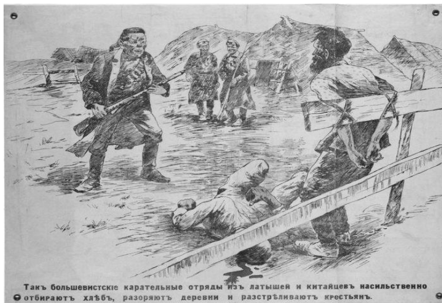
Рис. 2. «Так большевистские карательные отряды из латышей и китайцев насильственно отбирают хлеб, разоряют деревни и расстреливают крестьян»