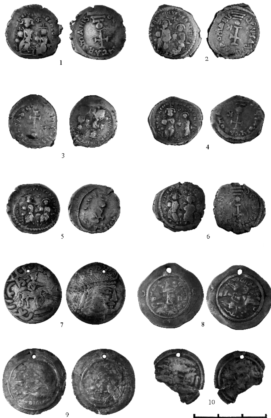
Рис. 3. Городище Усть-Сылва. 1 – 6. Восточно-римские гексаграммы Ираклия I и его соправителя Константина III; 7. Древнехорезмийская драхма Бравика; 8 – 10. Сасанидские драхмы Хосрова I