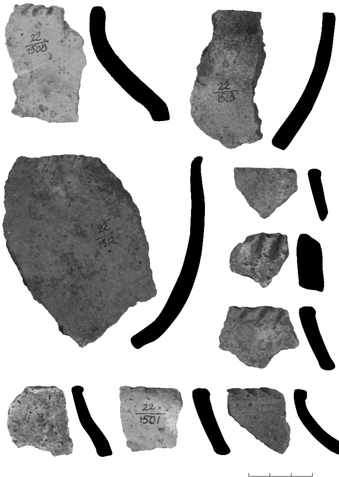
Рис. 2. Городище Усть-Сылва. Керамика ломоватовской культуры