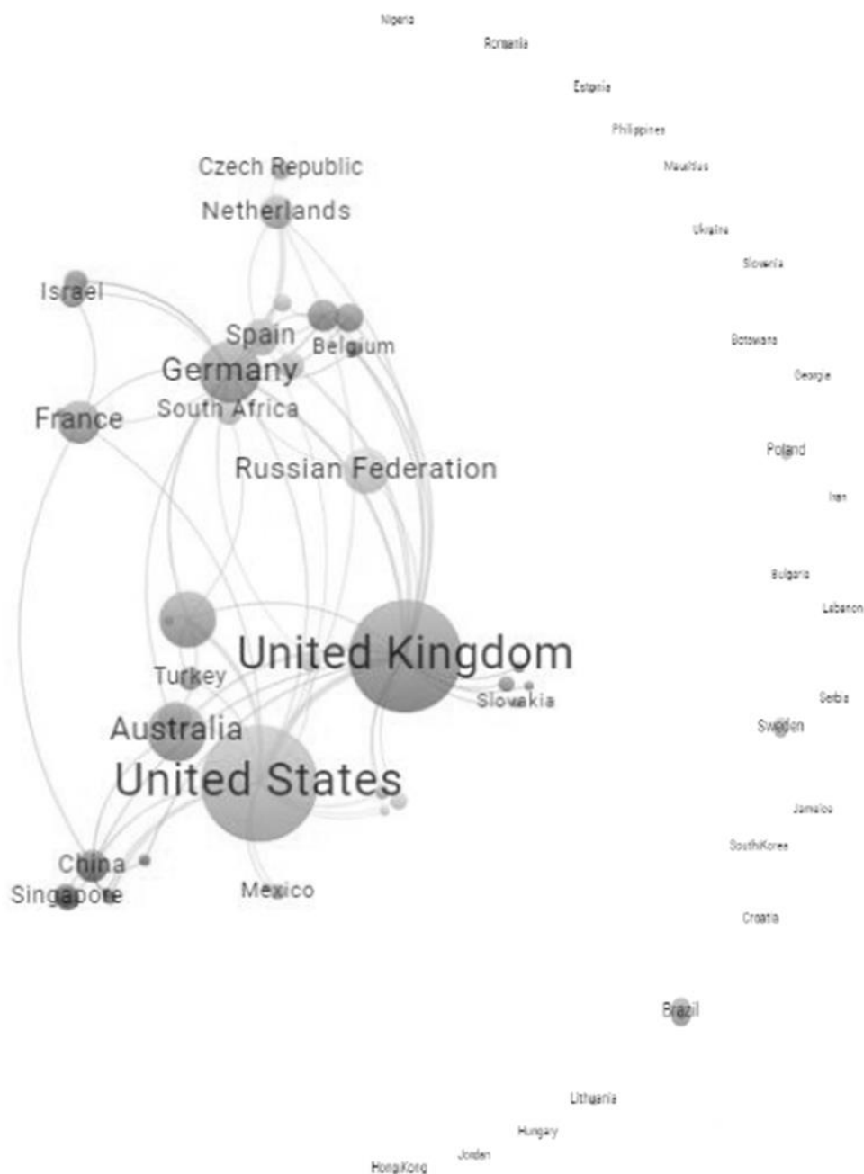
Рис. 2. Сеть соавторства стран

Оба исследователя действительно вносят существенный и последовательный вклад в осмысление темы исторических темпоральностей. Историк и антрополог Ч. Стюарт показывает в своих исследованиях разнообразие форм исторического опыта и переживаний времени в обозначенной выше парадигме П. Рикёра на примере людей и локальных сообществ, которые обычно бывают спрятаны «в тени историзма», сопоставляя выводы профессиональной историографии со способами и формами презентации обыденной коллективной памяти, предметно изучая локальные темпоральные дискурсы, и особенно – в периоды кризиса, ломающего линейные горизонты времени, на примере Греции и других стран Южной Европы ( Palmié, Stewart, 2019; Knight, Stewart, 2016 ).