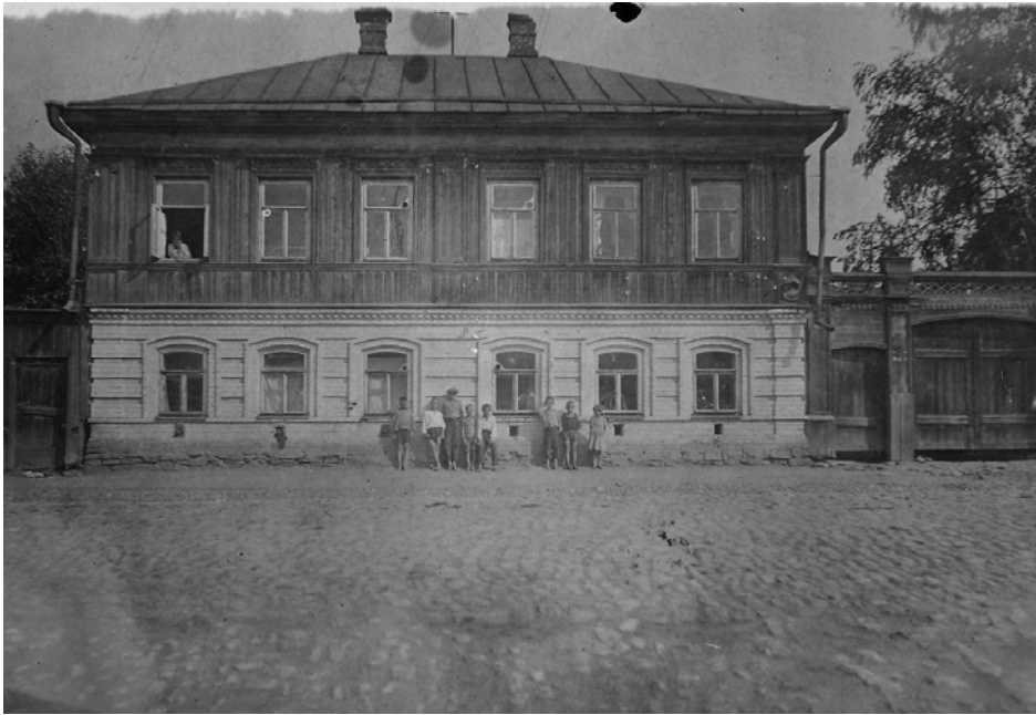
Мальчишки у дома по ул. Советской, 80 (г. Пермь, 1930-е гг.)

«Помню просторный грязный двор и низкие домики, обнесенные забором. Двор стоял у самой реки, и по веснам, когда спадала полая вода, он был усеян щепой и ракушками, а иногда и другими, куда более интересными вещами».