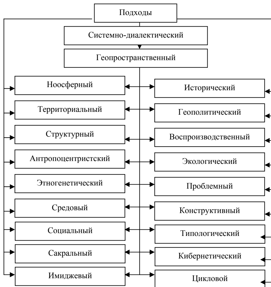
Рис. 2. Подходы к познанию пространственной организации общества и ТОЭС

Важнейшей категорией науки станет географическое пространство-время, понимаемое как сочетание географических объектов и совокупности связей и отношений между ними. Интегрированная форма объективного проявления и субъективного восприятия географического пространства-времени может стать базисом формирования пространственно-временной парадигмы в географической науке [27]. Эта парадигма может стать одним из интеграторов общей географии, получая углубленное развитие при исследовании природно-географического и общественно-географического подпространств в системе естественной и общественной географии.