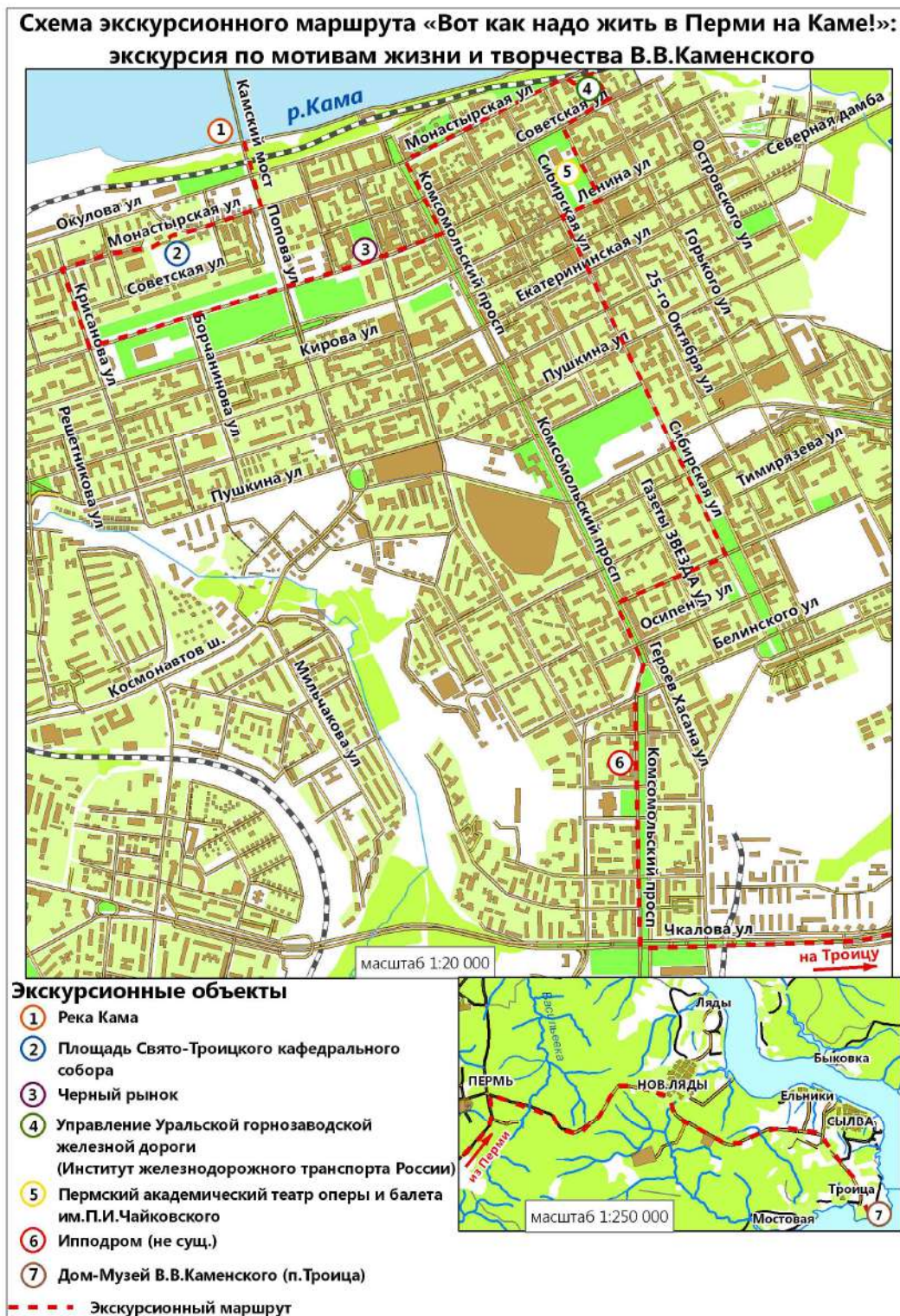
Рис. 2. «Вот как надо жить в Перми на Каме!»

Годы учебы описаны Каменским в автобиографической прозе: «Мы начали учиться по-славянски, и первой нашей книгой был часослов. Мы учили молитвы наизусть и потом их все пели, и учили закон Божий, и писать и считать». Через два года школа Василию опротивела и его перевели в городскую, что находилась на базаре. Там было интереснее, больше книг, больше ребят и шалостей, из окон видно, как торговали на базаре, ловили жуликов, бегали городовые. А однажды в школу торжественно приехал архиерей и задавал вопросы по Закону Божию: «За что изгнал Господь из рая Адама и Еву?». «А за то, что Адам и Ева без позволения съели все яблоки» – ответил Василий. Владыка улыбнулся. Все захохотали.