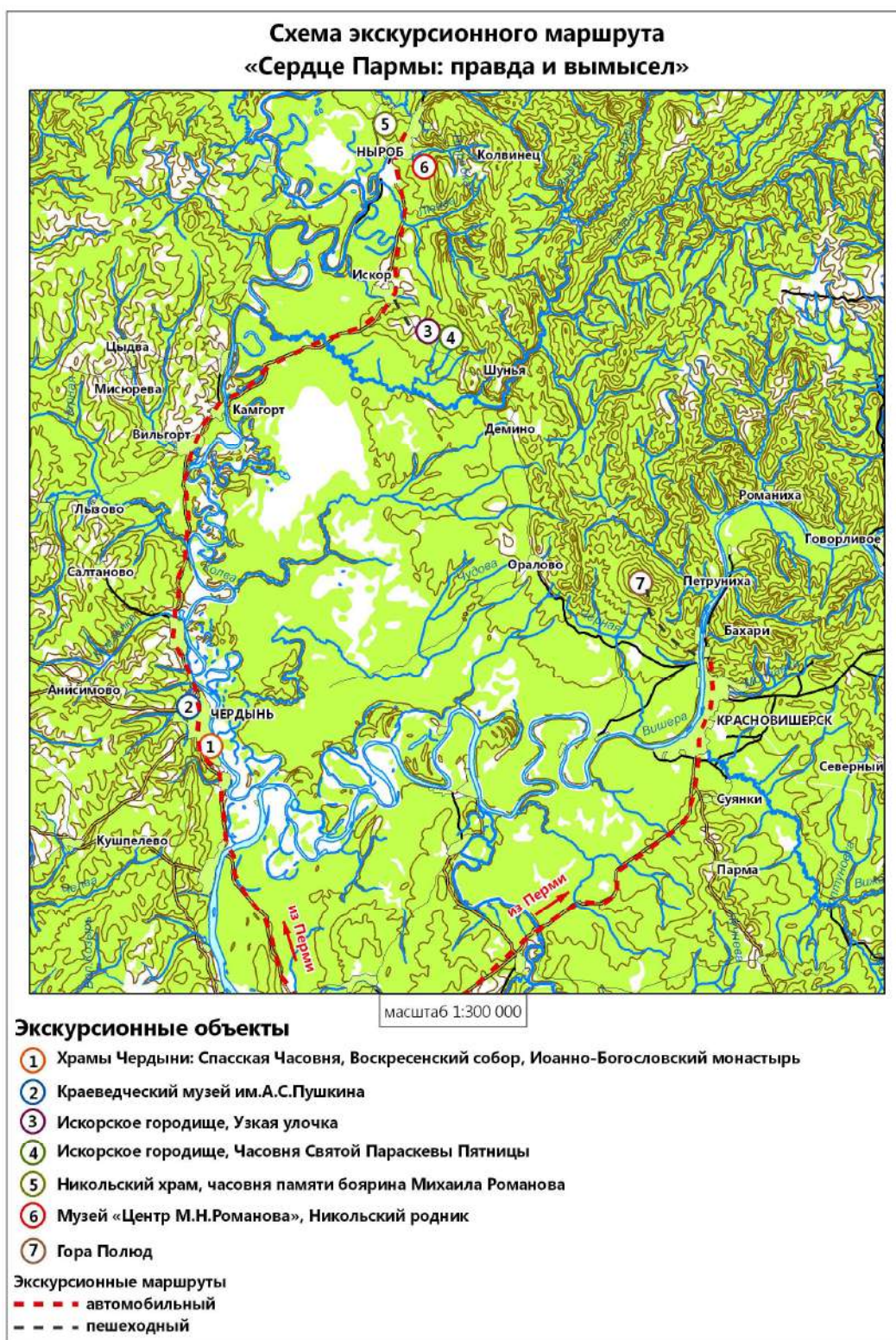
Рис. 3. «Сердце Пармы»: правда и вымысел

северной стены, а потому ночью на ней не было дозора, как на угловых башнях. От греха на ночь ее запирали снаружи на засов с амбарным замком; приставные лестницы, что вели с валов вдоль частоколов на боевую площадку, забрасывали на обходы. Караульные проверяли порядок только снаружи. Северная стена была, пожалуй, самой безопасной, так как выходила на овраг Чердынки — крутой, кривой, непролазно заросший лозняком, а по другому склону огороженный крепкой стеной монастыря. К северной стене острога лепились всякие хозяйственные постройки: амбары, конюшни, бретьяницы, дровяники, сараи. Готовясь к московитской осаде, в острог навезли полно всякого нужного припаса» (там же, с. 198).