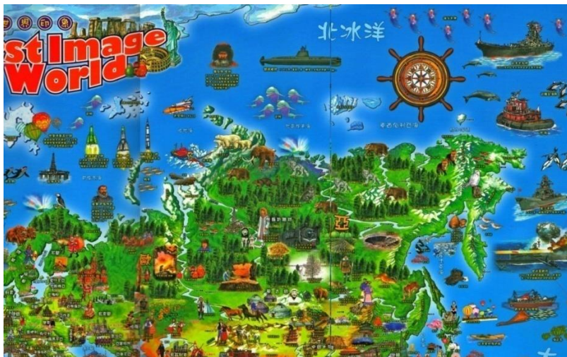
Рис. 1. Фрагмент карты “First Image of the World” [35] с образом России

Учитывая значимость для самоосознания Тайваня континентального Китая (КНР), важны изменения, произошедшие в изображении северного соседа. Если на англоязычной карте 1996 г. Китай был представлен через образы панд, бамбука, чайных плантаций, рикши, тронного зала Чаотан (朝堂), то на карте 2017 г. мы видим множество памятников искусства, включая всемирно известную Великую Китайскую стену и терракотовую армию в Сиане, новые выдающиеся здания (например, телебашню Гуанчжоу с ее гиперболоидной конструкцией сетчатой оболочки, телебашню «Восточная жемчужина» в Шанхае), стоянки древних людей [28], а также сохранившиеся с прежней карты изображения чая и панды двух видов – большой (королевской) и малой (красной). В этой связи следует отметить, что в мае 2005 г. правительство КНР предложило подарить властям Тайваня пару панд, которые впоследствии получили имена Туань-Туань и Юань-Юань (вместе они составляют слово, обозначающее «воссоединение»). Однако тайваньский президент Чэнь Шуйбянь отказался принимать подарок, и панды прибыли на остров только после возвращения к власти партии Гоминьдан в 2008 г.