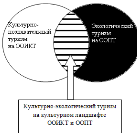
Рис. 2. Положение культурно-экологического туризма в системе туризма

Таким образом, к культурно-экологическому туризму, находящемуся на стыке культурно-познавательного и экологического туризма, можно отнести туристскую деятельность, имеющую деятельностно-практический характер, направленную на активное познание и сохранение наследия как подлинного, целостного и взаимообусловленного образования (рис. 2). Данное определение подразумевает под собой учет феномена культурного ландшафта, а также конструктивное отношение туриста к объектам наследия.