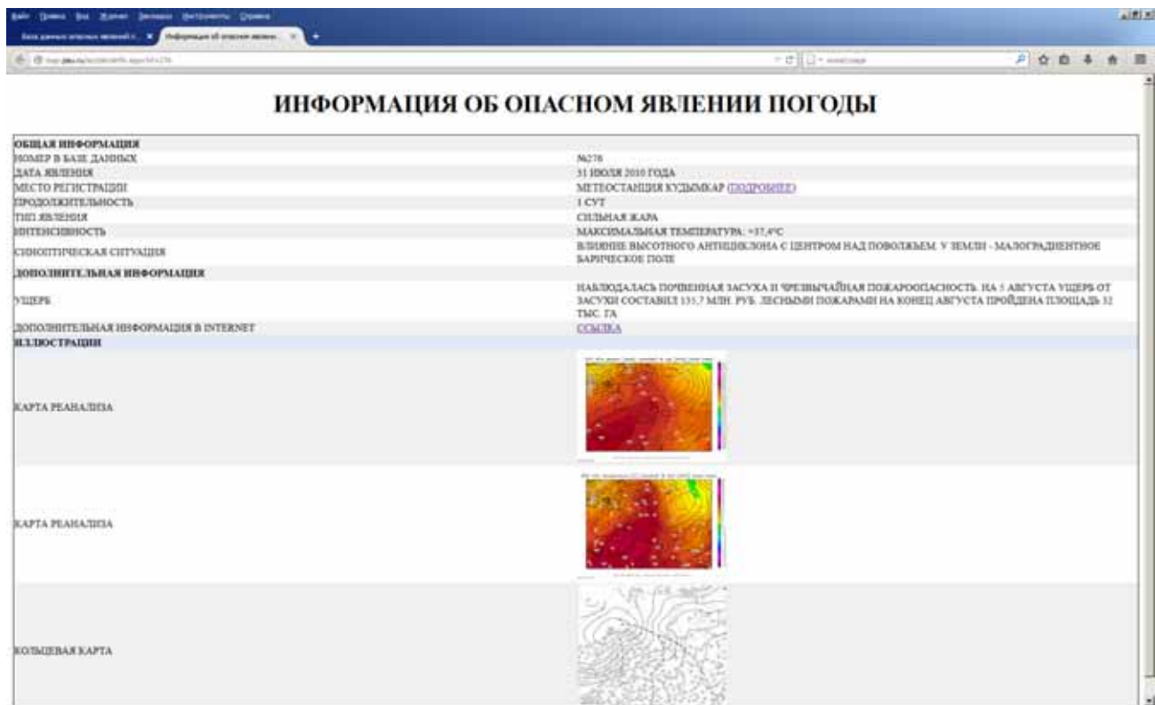
Рис. 2. Заполненная форма «Информация об опасном явлении погоды»

Дополнительные данные об опасных явлениях – это различные графические и картографические материалы, иллюстрирующие условия развития опасного явления и его последствия. Они могут быть полезны для специалистов при выполнении анализа условий развития ОЯ. Дополнительные данные привязаны к каждому случаю ОЯ, причем в зависимости от типа явления используется различный набор данных. Хранение дополнительных данных организовано в системе каталогов на сервере. Подробное их описание приведено в табл. 3. Пример заполненной формы с информацией об опасном явлении и дополнительными данными приведен на рис. 2.