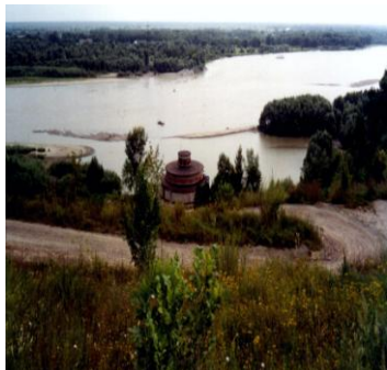
Рис. 2. Водозабор на р. Оби у г. Барнаула, перекрытый сместившимися отмелями, и опора ЛЭП, для защиты которой от размыва правый берег был укреплен каменной наброской Fig. 2. The water intake on the Ob River near Barnaul, blocked by shifting shallows, and a power line support (to protect it from erosion, the right bank was strengthened with dumped riprap)

руслового комплекса рек при добыче из ее русла и поймы полезных ископаемых: переход стока из наземного в подземный нарушает гидрогеологические условия приречных территорий, что приводит к подтоплениям, суффозионным просадкам под зданиями и сооружениями [8].