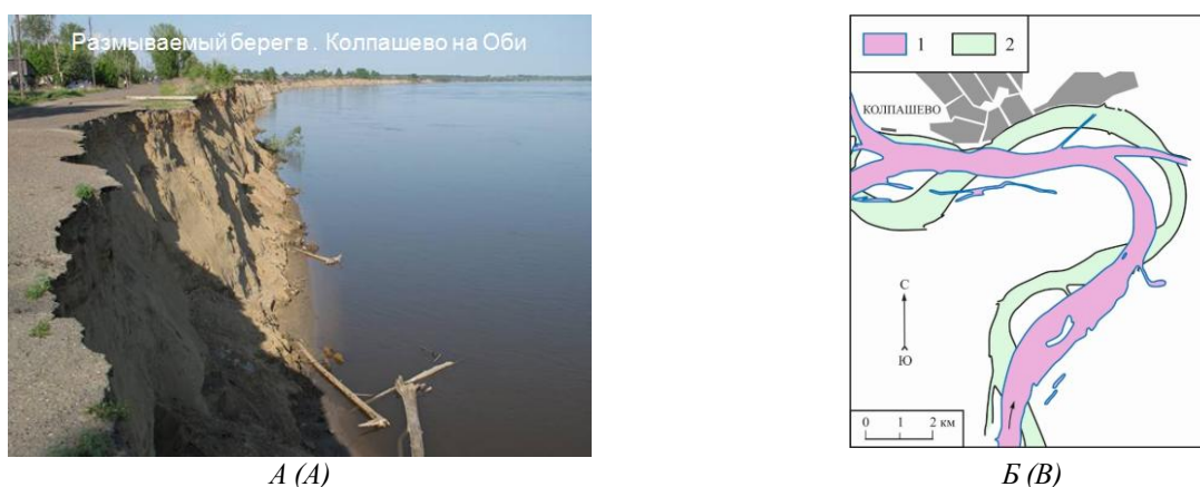
Рис. 1. Переформирования русла р. Оби, создающие опасность для г. Колпашево: А – размываемый берег; Б – изменения русла по мере размыва вогнутого берега и смещения излучины. Положения русла: 1 – в 1910 г.; 2 – в 2010 г. [4, с изменениями] Fig. 1. Reshaping of the Ob riverbed, which creates danger to Kolpashevo. А – eroded bank; Б – changes in the channel as the concave bank erodes and the bend shifts. The riverbed position: 1 – in 1910; 2 – in 2010 [4, with changes]

Смещение форм руслового рельефа (перекатов, побочней, осередков) вызывает серьезные затруднения для судоходства, приводя, зачастую, к посадке судов на мели и срыву перевозок. Надвижение скоплений наносов (отмелей) на водозаборы и выпуски сточных вод затрудняют промышленное и коммунальное водоснабжение, снижают эффект рассеивания вредных примесей [11]. Берега, противоположные прирусловым отмелям, обычно размываются, создавая аварийную обстановку для находящихся на них инженерных и других объектов. На фотографии (рис. 2) – участок р. Оби выше г. Барнаула, на левом коренном берегу которой основной коммунальный водозабор города оказался отгороженным мелями от основного русла. Поэтому для обеспечения подачи к нему воды здесь регулярно проводятся землечерпательные работы, разрабатываются подводящие к нему воду прорези. На противоположном правом берегу в створе водозабора находится опора ЛЭП, для сохранности которой и других опор пришлось возводить берегозащитное сооружение из каменной наброски протяженностью почти 1,5 км, предотвратившее от размыва весь вогнутый берег излучины. Занесение движущимися наносами акваторий портов и пристаней создает аварийную обстановку и затрудняет транспортное сообщение по рекам [14].