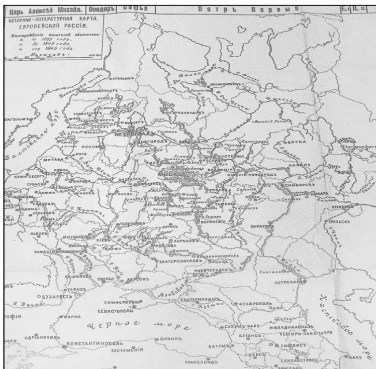
Рис. 1. Историко-литературная карта России 1916 г. [6]