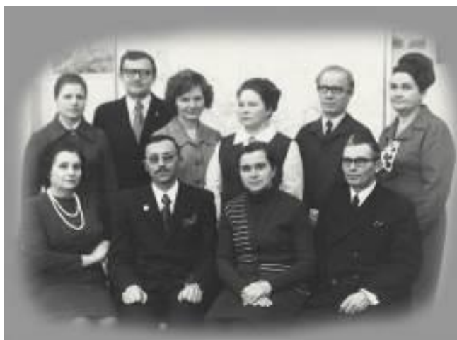
Рис. 3. Ведущие сотрудники кафедры экономической географии ПГУ, 1972 г.