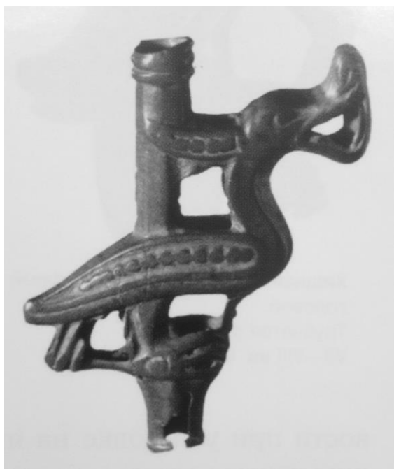
Рис. 2. Фото пронизки «Утка» (сохранена подпись А.В. Доминьяка: «Птице-собака. Полая трубчатая пронизка. VI-VII вв.»)

Другие исследователи, например Л.С. Грибова [4], делают несколько важных и, на наш взгляд, верных заключений, относя их к рангу закономерностей : преобладают изображения животных местной фауны, мало домашних животных, пермский звериный стиль – явление местное, как отражение особой идеологии, возникшей на базе ведения охотничье-рыболовецкого хозяйства. В основе сложных образов лежат представления о всеобщей естественной связи в природе, которые были свойственны человеку в период родового строя, когда он не выделял еще себя из окружающей его среды и переносил на нее социальную структуру своего общества.