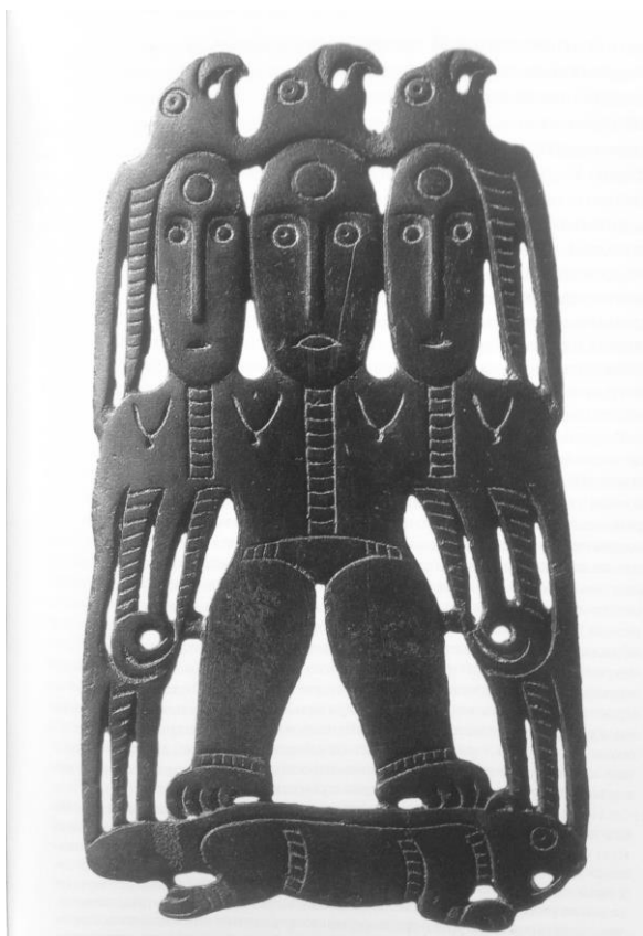
Рис. 5. Стилизованные человеческие фигуры, стоящие на бобре (подпись из книги В.А. Оборина, Г.Н. Чагина: «Прорезная бляха. VIII–IX вв. Один из интереснейших вариантов так называемого космогонического сюжета. Крылатая трехликая богиня стоит на ящере. Над каждым ликом – по грифону»)

Отдельно стоит сказать о птицах. Специалисты по пермскому звериному стилю в большинстве источников пишут только «птица» или добавляют следующие характеристики: «большая птица», «маленькая птица» и лишь изредка уточняют «хищная птица (орел?)» [4, с. 27]. Полагаем, что орнитологи и биогеографы вообще должны увидеть здесь целое «поле» для своих исследований. Специалисты-историки слишком легко «оперируют» названиями птиц: «... к фратрии орла (ястреба)», – пишет Л.С. Грибова [4, с. 69]. Другое дело, если изображение не позволяет определить видовую принадлежность, то тогда следует оперировать более высокоранговой таксономической категорией – род, семейство, отряд и т.п.