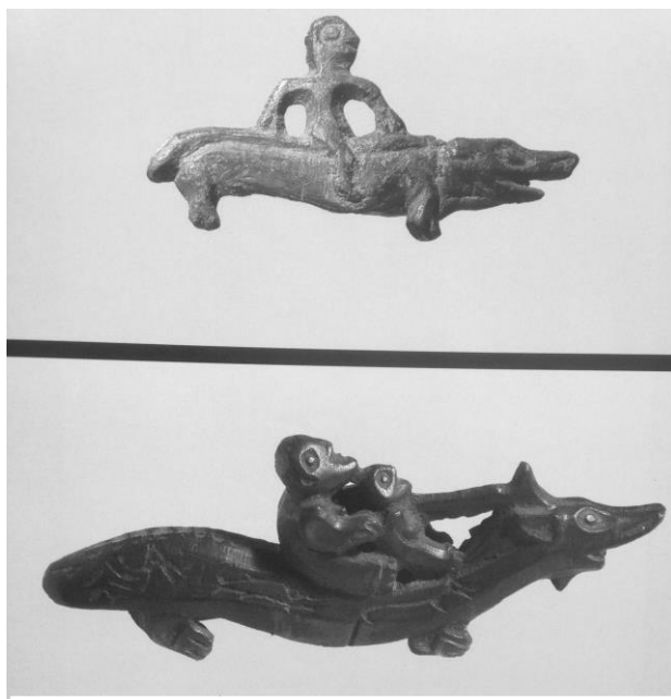
Рис. 4. Человеческие фигуры верхом на рыбе (сохранена подпись историков к фото: «Подвеска в виде всадника на ящере. VIII-IX вв. Одностороннее изображение; «Полая подвеска с объемными фигурами двух людей, сидящих на ящере. VIII-IX вв.»)

Не рискует закрепить свои выводы в итоге и Л.С. Грибова, называя изображение на бронзовой бляхе, найденное близ дер. Ныргында бывшего Сарапульского уезда Вятской губернии [4, с. 129, табл. I, 5], «классическим изображением «ящера». По самому изображению, без сомнений, видно (рис. 3), что речь идет о крупной и хищной рыбе, внутри которой изображены более мелкие рыбы, вероятно, чтобы изобразить ее хищный образ жизни.