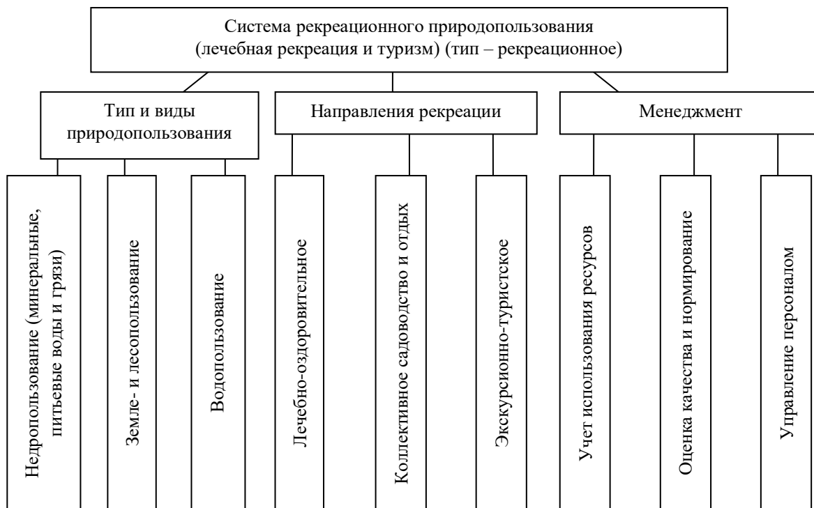
Рис. 2. Структура системы рекреационного природопользования

здоровья общества. Экономическая функция заключается, главным образом, в восстановлении рабочей силы.