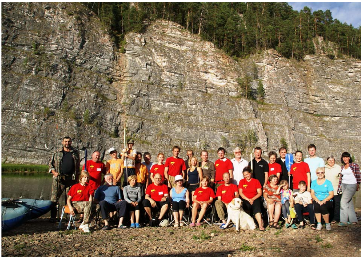
Рис. 2. Участники семинара

Продолжением разговора о разнообразии направлений и необъятных ресурсных возможностях туризма в глубинных территориях стало выступление А.В.Фирсовой (ПГНИУ). Речь шла о новом понятии в туризме – литературном картировании, когда известное художественное произведение играет роль основного ориентира в географическом пространстве, превращается в своеобразную карту места. На примере романа А. Иванова «Сердце Пармы», местом событий в котором выступает Чердынский район Пермского края, захватывающе интересно, эмоционально ярко показано, как пространство становится одним из главных субъектов действия, влияет на чувства и поступки героев. Роман Иванова создал пространственный образ, карту территории и положен в основу авторского литературного маршрута «"Сердце Пармы": правда и вымысел». В ходе обсуждения были высказаны суждения о правомерности введения в научный и практический оборот понятия литературного картирования. Всех участников семинара заинтересовали книги Иванова, многие захотели немедленно их купить.