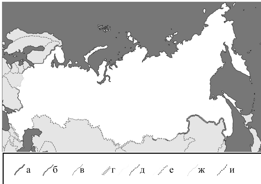
Рис. 3. Степень прозрачности границ Российской Федерации

**** с 2011 г. Росстатом фиксируется увеличение числа мигрантов с КНДР в 10–12 раз, а в 2014 г. - в 25–30 раз по сравнению с 2010 г., что говорит о существенном увеличении прозрачности границы КНДР с Россией, но достоверных сведений о причинах такого изменения найти не удалось.