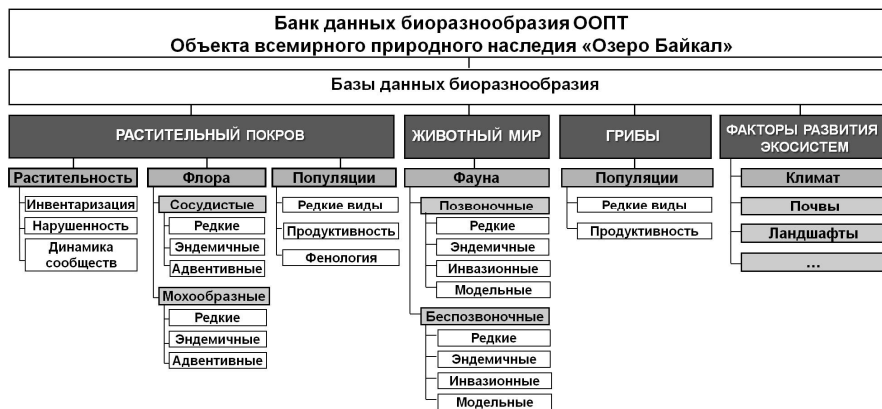
Рис. 2. Банк данных биоразнообразия

Банк данных биоразнообразия. В результате формализации и обобщения разновременных показателей «Летописи природы» ООПТ исследуемой территории в БИП СО РАН сформирован банк данных биоразнообразия. Объекты мониторинга биоразнообразия выделяются на видовом и экосистемном уровнях. Банк данных биоразнообразия ООПТ включает базы данных: растительный покров; животный мир; грибы; факторы развития экосистем (рис. 2).