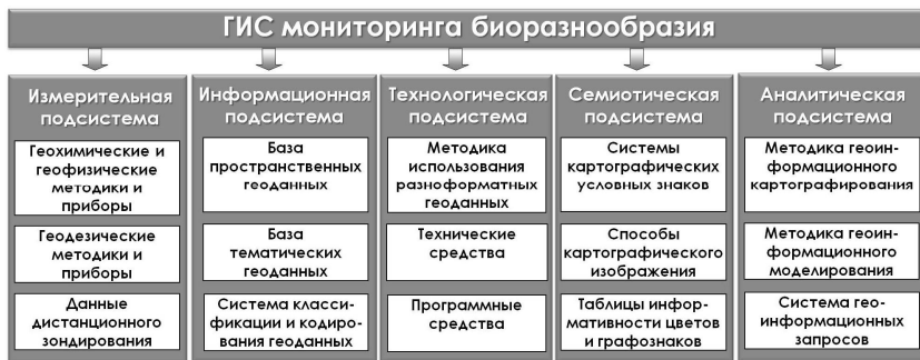
Рис. 3. Функциональная структура ГИС биоразнообразия

Для осуществления мониторинга биоразнообразия и последующего внедрения в администрации ООПТ в Байкальском институте природопользования СО РАН создана проблемно-ориентированная ГИС, состоящая из пяти открытых подсистем (рис. 3).