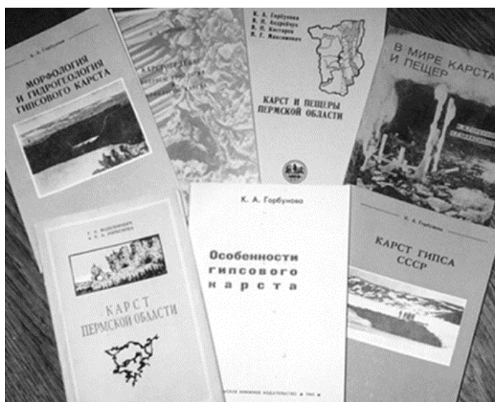
Рис. 3. Монографии К. А. Горбуновой

Всего К. А. Горбуновой опубликовано 328 научных, научно-методических, научно-популярных работ общим объемом около 150 печатных листов. Среди них 8 монографий: «Карст Пермской области» [29], «Особенности гипсового карста» [4], «Карст гипса СССР» [5], «Морфология и гидрогеология гипсового карста» [6], «Карстоведение. Вопросы типологии и морфологии карста» [7]; «Техногенное воздействие на геологическую среду Пермской области» [24], «В мире карста и пещер» [22], «Карст и пещеры Пермской области» [10]; а также глава «Озера карстовых районов» в фундаментальной 2-томной монографии Г. А. Максимовича «Основы карстоведения» (Т. 2) [30] (рис. 3).